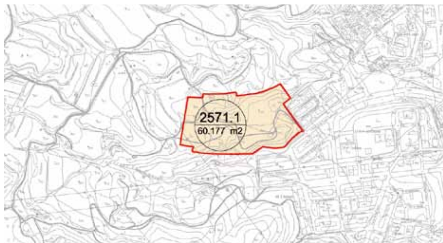
Plànol de l'Àrea Residencial Estratègica

Després de moltes reunions de treball, estem a l'espera de veure com es resolen les alegacions per continuar la tramitació urbanística futura del l'esmentat sector.