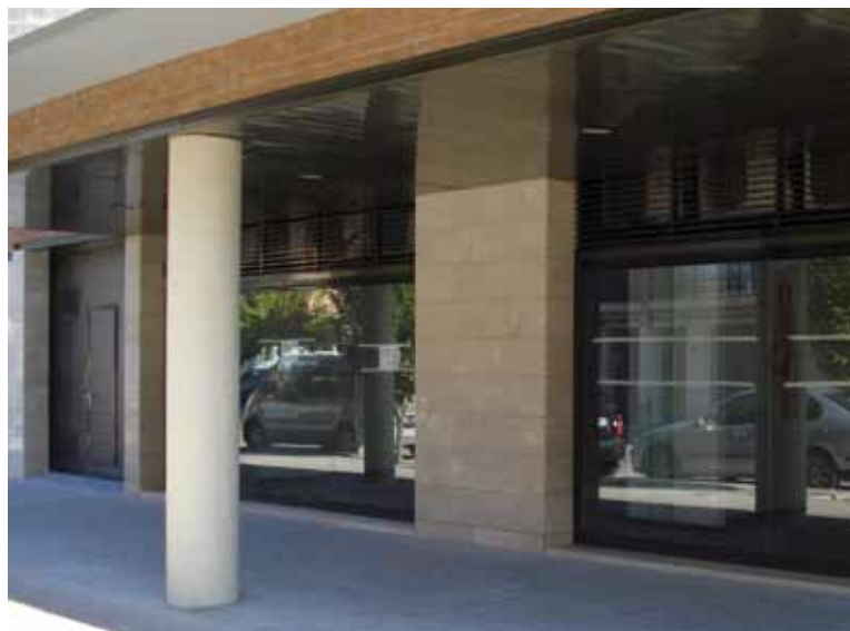
Noves dependències de la Policia Local

Ens hem de felicitar per aquest nou espai modern i ben equipat, esperant que a mitjans de desembre puguem inaugurar-lo, fent-lo coincidir amb la festivitat de la patronímica de la Policia Local. Actualment la plantilla de la policia local està formada per un sergent, dos caporals, onze agents i una auxiliar administrativa.