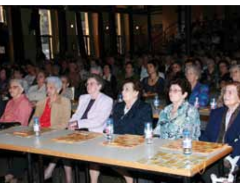
Avis i àvies, nascuts a l'any 1925