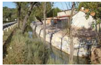
Sanejament de la zona esportiva