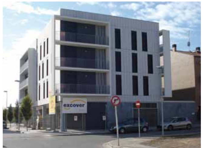
Habitatges de protecció oficial

Tenint en compte que ja tenim a punt les noves dependències de la Policia Local i atenent que amb la seva marxa recuperem espai a la planta baixa, hem plantejat un projecte d'ampliació de l'espai per a l'atenció social. Tanmateix el projecte permetrà disposar d'un despatx per a la utilització dels diferents grups municipals presents a l'Ajuntament, una sala de reunions per al públic en general i un espai per a l'atenció al ciutadà, tot en la mateixa planta