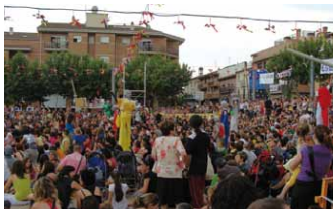
Espectacle sobre els planetes, en commemoració de l'any de Galileo-Galilei

Des d'aquí volem encoratjar i agrair totes les persones que han fet possible que la FMI esdevingui un senyal identitari de prestigi i de reconeixement com a poble. Ens veiem a la 22ena!!!!