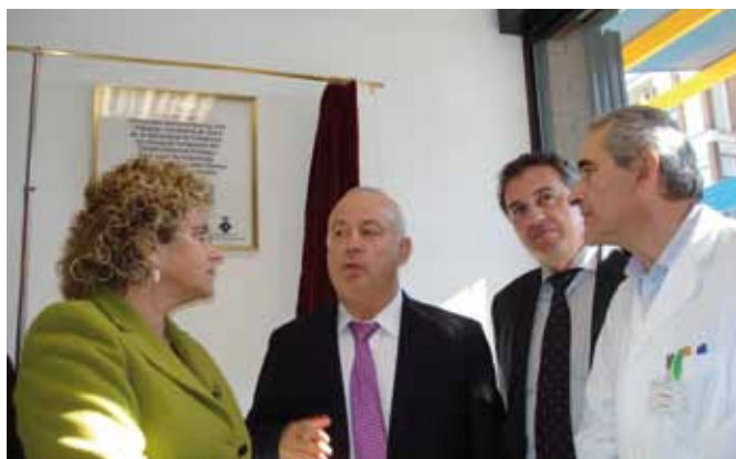
Inauguració de l'ampliació del CAP

En el parlament de la Consellera va avançar que del desplegament de l'ACUT se'n parlaria passat l'hivern, tot intentant un ampli consens entre les parts. La intervenció de l'alcalde, entre altres, va referir-se a que l'Ajuntament no acceptaria una solució que suposi una disminució real de la qualitat del servei.