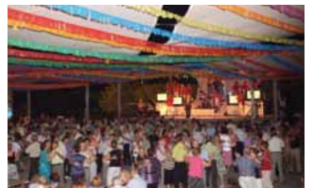
Ball de Revetlla