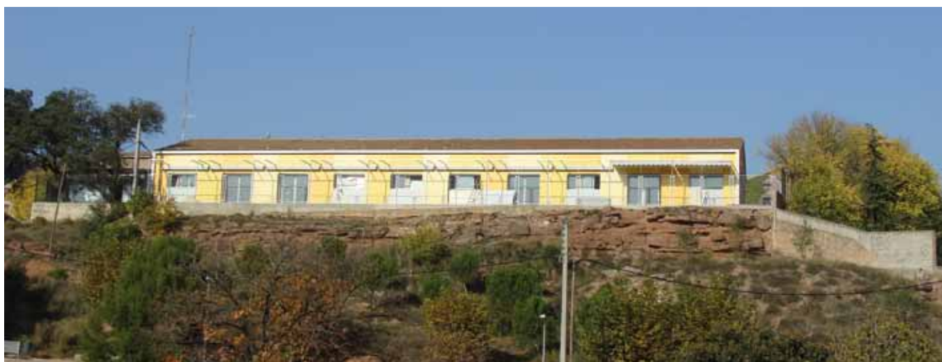
Remodelació de la façana sud de la Llar Municipal d'Infants El Xiulet.

Amb la idea d'anar completant i acabant els sector del Mas Sant Joan, el conjunt d'obres preveu una nova entrada per la Llar d'Infants Municipal El Xiulet. Tanmateix el projecte contempla la remodelació de la façana Sud amb una millor impermeabilització, sortides a l'exterior per a totes les aules i una ampliació de l'espai de pati. El pressupost de l'obra és de 171.258 euros i ha estat subvencionat pel Pla d'Obres i Serveis de la Generalitat amb 78.159 euros i per la Diputació de Barcelona amb 84.244 euros. Vull aprofitar l'avinentsa per agrair la paciència infinita que estan demostrant tant els usuaris com les educadores, sense la comprensió dels quals no hauria estat possible la profunda transformació que està experimentant aquesta Llar d'Infants municipal.