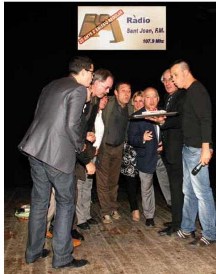
Pastís de celebració dels 25 anys de ràdio Sant Joan

Ara també, s'obre un període de reflexió per tal d'avaluar el moment actual, davant la voràgine de mitjans i el canvi tecnològic que vivim. Entre tots i totes, de ben segur trobarem el camí adequat perquè els mitjans de comunicació local trobin el seu espai i el seu públic.