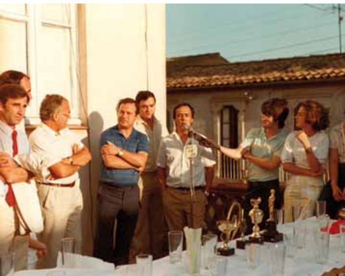
Ràdio Sant Joan fa 25 anys endarrere