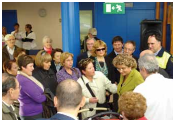
Visita de la Consellera de Salut al CAP

No s'acceptarà cap mesura que signifiqui la pèrdua de qualitat en l'atenció sanitària urgent adquirida fins avui.