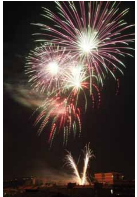
Castell de focs

No hem d'oblidar els nombrosos actes que es van programar durant tot el mes de juny: les festes dels barris, el concert musical de La Verbena, el festival folklòric, el teatre, les activitats esportives, les exposicions,... sense oblidar la gran festa per als més petits, la Festa Major Infantil. En definitiva, un mes de juny en què el poble de Sant Joan viu envoltat de festa.