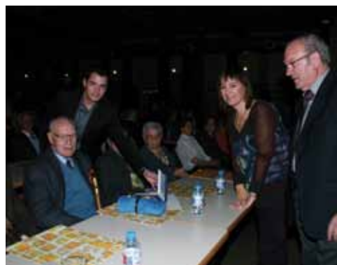
Homenatge a la gent gran per les autoritats