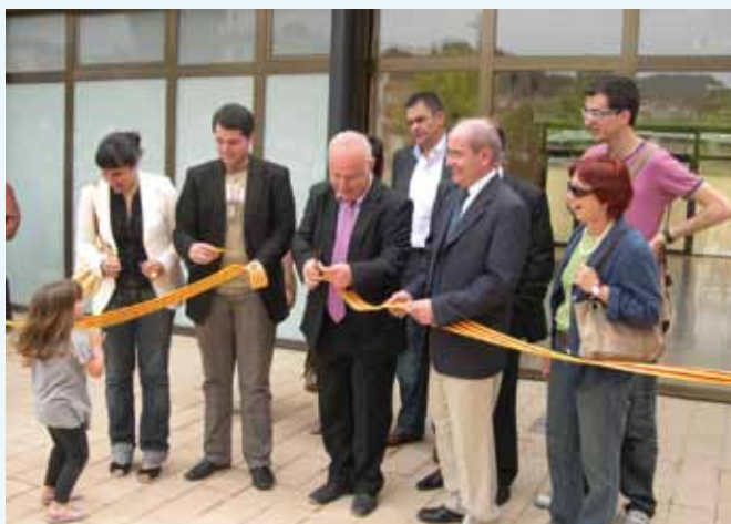
Inauguració de la Ludoteca Municipal i de la Sala Petita