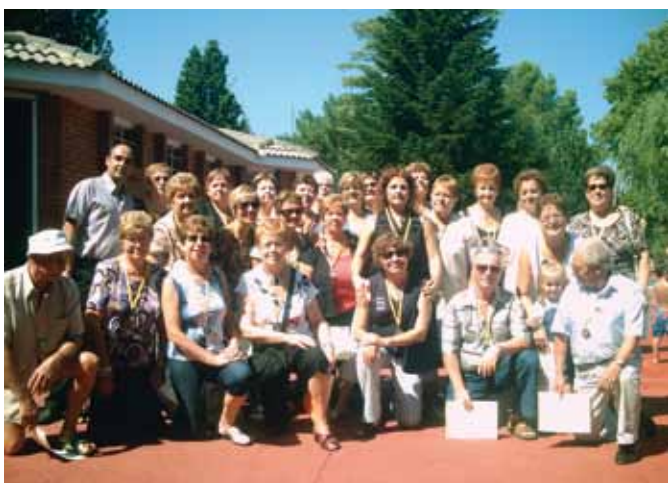
Entrega de medalles del curs de natació per a gent gran

Dir també que els cursos de natació han tingut una gran afluència de nens i nenes, que n'han après molt, i que estem molt contents de poder contribuir així en el seu aprenentatge. L'estiu també s'aprofita tot gaudint-ne.