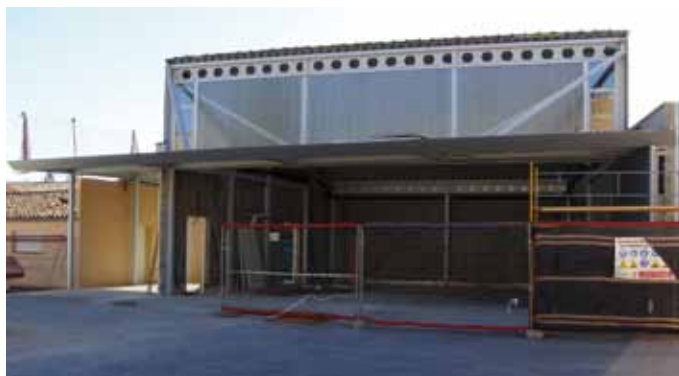
Nova Sala Polivalent de l'Escola de Música