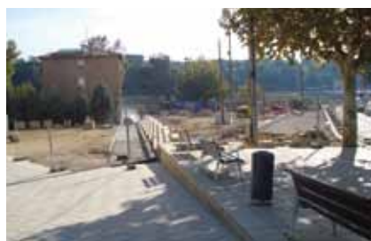
Urbanització sector sud de Cal Gallifa. Pendent de la col·locació del mobiliari urbà, de les lluminàries i el pintat i senyalització.