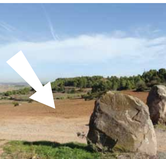
Terreny on s'ubicarà el nou cementiri

D'aquesta manera l'Ajuntament completa el procés de disposar del terreny que contempla el POUM per a la ubicació del nou cementiri.