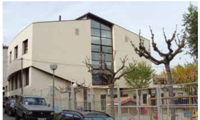
Residència Atzavara i Centre de Dia

La bona acollida del nou complex residencial L'Atzavara, ha fet que s'incrementin les demandes de menjador i de Centre de Dia. Per això el menjador s'ha ampliat de 25 a 35 places externes i el centre de dia de 15 a 25 places, a temps complet i parcial.