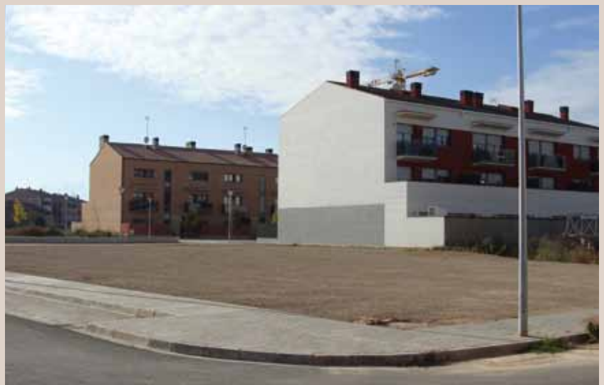
Aparcament públic sector Nord

Des de finals d'estiu, disposem d'un nou espai públic per aparcament gratuït de turismes que està situat al final del carrer Girona. Amb aquest són ja set els espais públics destinats a aparcament de vehicles.