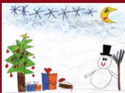
Guanyador del concurs de postals de Nadal entre el grup petit de la Ludoteca ( de 5 a 7 anys)

L'Ajuntament us desitja Bon Nadal i Felix any 2010!