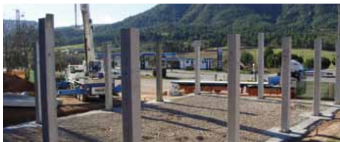
Construcció d'un edifici destinat a cobert municipal a Sant Martí de Torroella. En fase de muntatge de l'estructura.