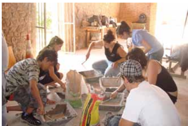
Visita a l'escola taller de construcció

Es basa en la participació en un cicle de tallers en els quals, prèvia entrevista personal, s'assessora en les eines bàsiques en la recerca de feina, així també com oferir la participació en un tast d'oficis. En els tallers es treballen aspectes tals com l'elaboració d'un currículum, com inscriure's en els principals portals d'Internet de recerca de feina, generació d'idees i creació d'empreses, habilitats personals en el mercat laboral, entre d'altres. Tot això, complementat amb visites a diferents empreses del municipi per veure la metodologia de treball, i la posterior realització de pràctiques en algunes d'elles, van proporcionar als beneficiaris dels esmentats tallers la possibilitat d'iniciar-se en el món laboral.