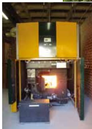
Caldera de Biomassa

Paral·lelament des de l'Ajuntament es tramiten i aproven els projectes sorgits des de la iniciativa privada, corresponents a la instal·lació de noves fonts d'energies alternatives com són les teulades i camps fotovoltaics per producció d'energia elèctrica i un projecte pioner realitzat per l'empresa MAFRICA en el camp de l'energia termosolar per a l'obtenció d'aigua calenta.