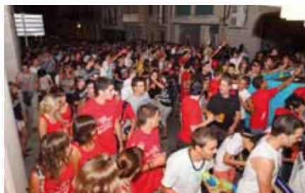
Festa dels Vilatorrats