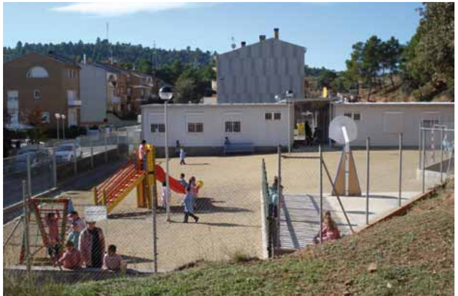
Adequació Pati del CEIP Ametllers