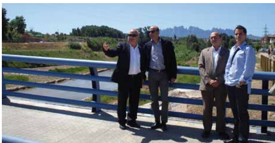
Visita del Conseller de Medi Ambient, Francesc Baltasar en motiu de la inauguració de l'arranjament del Riu Cardener

El pressupost de l'obra 1.377.454'30 euros ha estat finançat íntegrament per l'Agència Catalana de l'Aigua