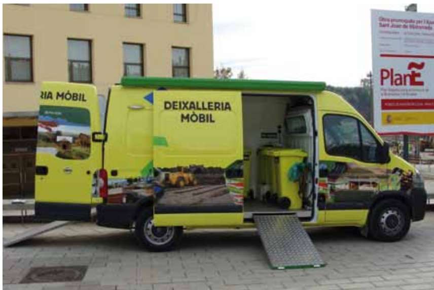
La deixalleria mòbil al mercat de Sant Joan

Utilitzant la deixalleria mòbil reduïrem els residus portats a l'abocador, allargant-ne així la seva vida útil i minimitzant l'impacte que aquests generen.