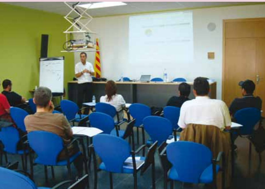
Seminari per a emprenedors

Amb un nivell de participació satisfactori, els beneficiaris van obtenir una primera formació bàsica per a la iniciació i desenvolupament d'un negoci. Els seminaris es van celebrar amb el suport de INICIA (Generalitat de Catalunya) i el Fons Social Europeu.