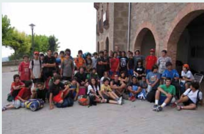
Colònies esportives 2009

L'Associació Esportiva de l'Institut Quercus ha dissenyat un programa d'activitats relacionades amb l'esport, molt adequat per aquestes edats. Aquests nois i noies han pogut gaudir de les instal·lacions municipals: piscines, pistes de tennis, pavelló de basket, camp de futbol, etc... També han fet sortides fora del nostre poble: excursió al Parc Aquàtic de Lloret de Mar, casa de colònies Castell Adral, Parc Aventura de Saldes, sempre molt ben acompanyats dels seus monitors. Dedicar-los temps és treballar per proporcionar-los un futur millor.