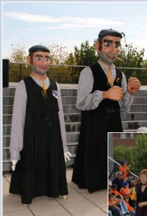
El nou gegantó, El Palillet i l'home del Palillo

També durant la Fira Festa Tardor van aparèixer en escena els dos nous capgrossos, el Carles i l'Alba, que els portaven l'associació "Les Oliveres". Unes figures que representen tots els avis i les àvies del municipi.