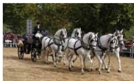
Espectacular exhibició d' hípica

Finalment, des d'aquí agrair a totes les persones, entitats i col·lectius que participen en l'organització de la Fira; sense tota aquesta gent, la Fira no seria possible. MOLTES GRÀCIES!