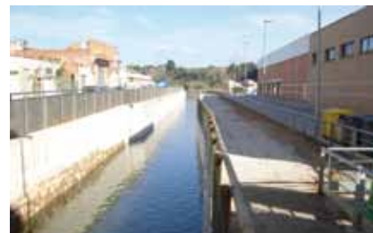
Endegament del canal