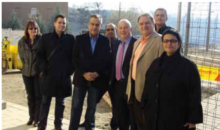
Visita del Ministre de Treball i Immigració, Celestino Corbacho.