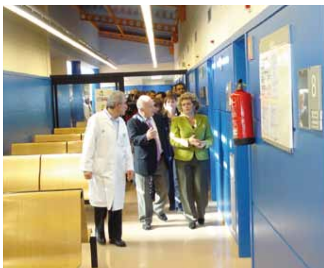
Visita de la consellera de Salut, Marina Geli a les noves instal·lacions del CAP