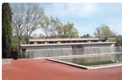
Reforma i ampliació de la piscina. Pendent de fer les instal·lacions i els alicatats interiors, i d'acabar la pavimentació i els revestiments exteriors.