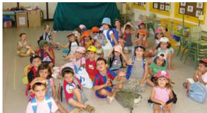
Colònies Urbanes: un moment de l'activitat

Però no tot són punts positius, i aquests són els que ens han de fer parar atenció per continuar millorant l'aposta per estar al servei de les famílies de Sant Joan. Malgrat que el preu total de les colònies ha estat valorat favorablement per un 94% de les famílies, sí que comenten que seria necessari més descomptes pels germans inscrits (actualment és d'un 10% a partir del segon germà) i per les famílies que s'inscriuen a la totalitat del període. Un altre aspecte a millorar des de la regidoria serà que les inscripcions de setembre es puguin fer a mitjans de juliol i no al mitjans de juny.