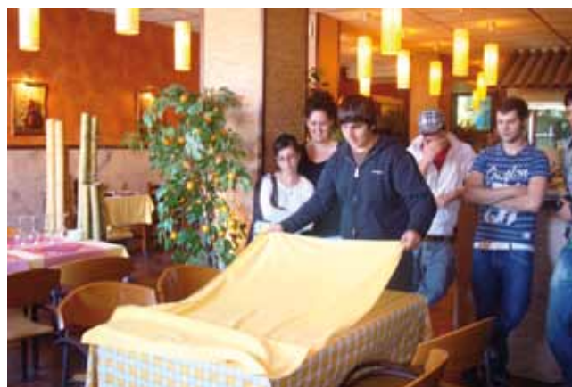
Visita a un restaurant