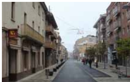
Urbanització Carrer Major.