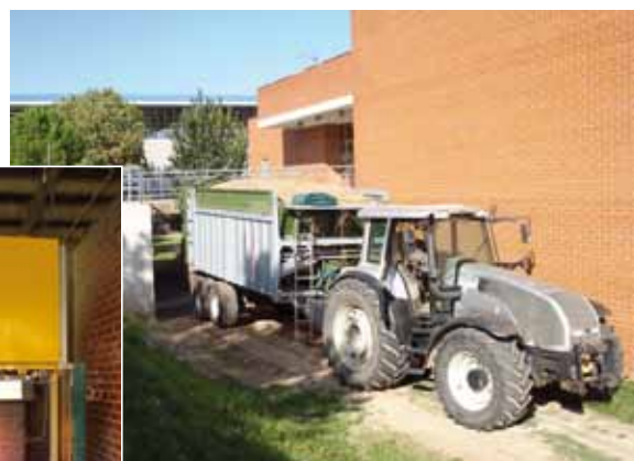
Recollida de restes forestals per a Biomassa