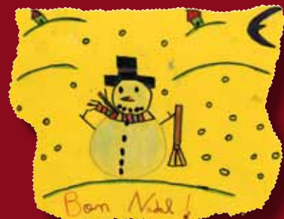
Guanyador del concurs de postals de Nadal entre el grup mitjà de la Ludoteca ( de 8 a 9 anys)

Aquest any s'ha constituït oficialment el Consell d'Infants de la Vila. Així doncs, la felicitació d'aquest any l'han fet ells per a tothom.