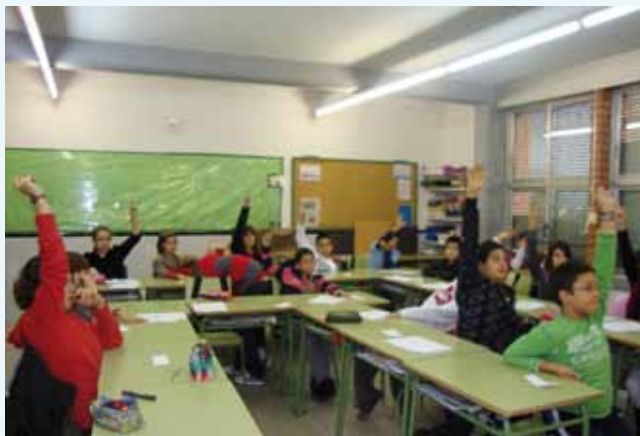
Treballs de preparació per al Consell d'Infants en una de les escoles del municipi.

ampli de celebració dels 20 anys de la convenció dels drets dels infants. Entre altres actes volem destacar una taula rodona programada per al primer trimestre del 2010 on també volem plantejar els deures i obligacions que tenen com a infants a través de l'educació, els límits i les responsabilitats.