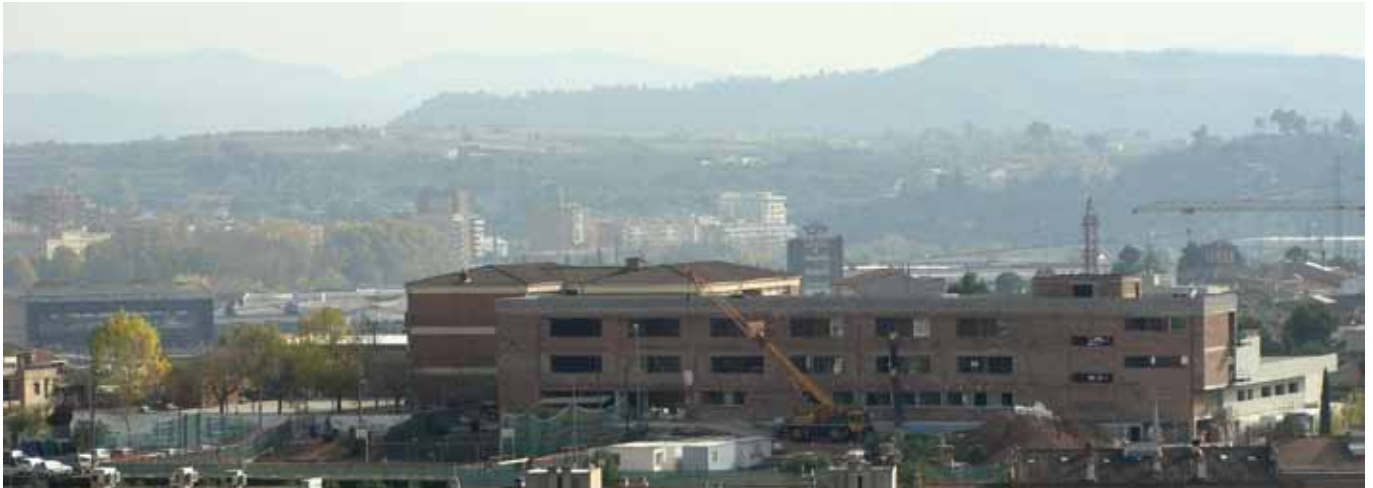
Bon ritme en les obres de la nova Escola Joncadella

línees que estrenarà el nostre poble i està previst que entri en funcionament el proper curs escolar. El pressupost de la nova escola és de 4.880.914 euros i ha estat finançat pel departament d'Ensenyament de la Generalitat.