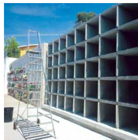
Fotografia dels nous nínxols

Els operaris també porten a terme tasques per millorar l'entorn del cementiri. Les obres preveuen endreçar l'exterior i enjardinar el talús i els voltants del cementiri. L'equipament està situat al costat de diferents centres educatius com són l'Escola de Música i la llar d'infants El Xiulet que