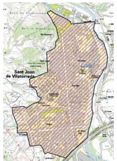
Zona on els gossos han d'anar lligats

L'Ajuntament de Sant Joan de Vilatorrada ultima els detalls de la nova ordenança de tinença d'animals domèstics que, entre d'altres, estableix l'obligatorietat que els gossos vagin lligats. Des del consistori es delimitarà un espai on els propietaris dels gossos tindran l'obligació de dur-los lligats. A la pràctica la prohibició de portar els gossos sense lligar afecta tota la trama urbana del municipi. Malgrat que la consciència de la gent cada vegada és major encara es donen casos de veïns incívics que no respecten les normes bàsiques de convivència. L'ordenança pretén ajudar a solucionar els petits conflictes que es generen.