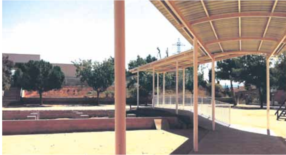
El pati de l'Escola Collbaix guanya nou espai amb la retirada del mòdul prefabricat

A més, les obres també han permès retirar el mòdul prefabricat que hi havia al pati i d'aquesta manera es guanya més espai destinat al lleure