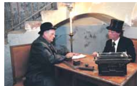
Quatre imatges de la primera edició de la festa, que vol repetir l'èxit de l'any passat