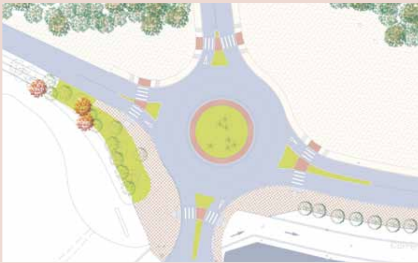
Plànol de la futura rotonda, les obres de la qual podrien començar el gener

L'Ajuntament de Sant Joan accelera els tràmits per fer realitat la nova rotonda a la zona esportiva del municipi. El projecte pretén ordenar la circulació i millorar la mobilitat i la seguretat d'un sector molt transitat.