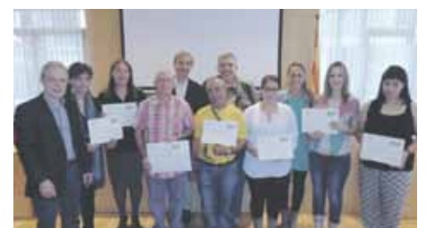
Grup de voluntaris homenatjats