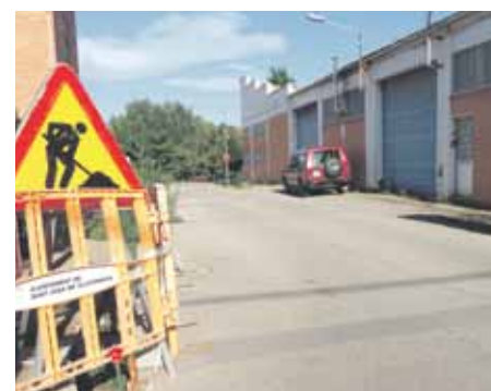
Imatge del tram final del carrer Balmes

Abans de final d'any també s'enderrocarà l'edifici de Can Bargay que ha quedat en desús. Finalment, s'instal·larà una font d'aigua al parc infantil del carrer Prat.