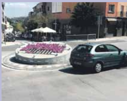
Imatge de la nova rotonda

Aquest estiu han finalitzat les obres de millora de la nova rotonda a la cruïlla dels carrers Torrent Canigó, Manresa i Avinguda Montserrat. Els darrers ajustos han permès canviar els llums led que ara són de color blanc i milloren la visibilitat a la nit.