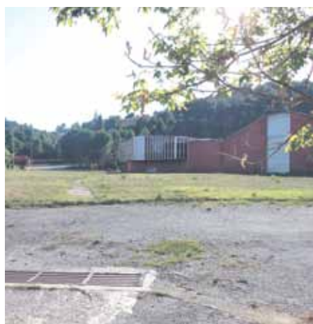
Imatge de l'antic espai tèxtil

El complex se situa a prop de l'IES Quercus i reserva el 45% del sòl per als propietaris (espai privat), i el 55% restant per a espai públic. La zona privada contempla un màxim de 296 habitatges, dels quals 208 serien de règim lliure, 59 de protecció oficial i 29 de protecció concertats. Pel que fa a la zona pública de moment no hi ha cap projecte damunt la taula