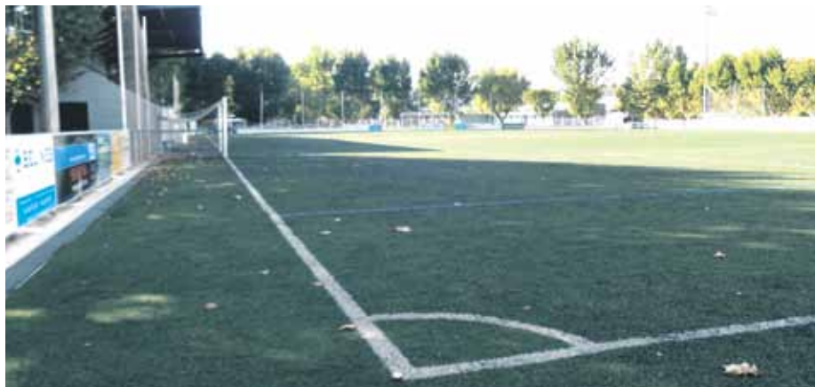
Imatge del camp de futbol que continuarà tenint millores

El proper pas serà la col·locació de seients de plàstic a la graderia. La barana de la graderia, les canonades d'aigua i les vàlvules reguladores dels vestidors també se substituiran. Aquesta serà l'última fase de rehabilitació. Fins ara s'han pintat i arranjat els vestidors, s'han posat baranes i protectors de seguretat i s'han mi-