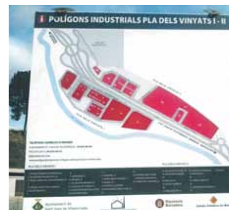
Cartell informatiu dels polígons

En el marc de les accions que s'estan portant a terme per millorar l'atractiu dels polígons d'activitat econòmica del municipi, l'Ajuntament ha instal·lat un nou cartell informatiu dels Polígons Industrials Pla dels Vinyats I i II. El panell inclou un mapa de les àrees d'activitat econòmica amb totes les empreses que mantenen l'activitat.