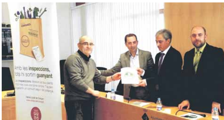
Imatge de l'acte de lliurament dels certificats de qualitat

Aquesta prova pilot, que ha tingut un any de durada, ha permès constatar la bona predisposició del comerç a posar-se al dia en diferents temes relacionats amb la informació i els drets dels consumidors. Un total de