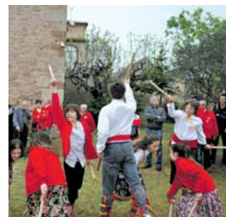
Grup de caramellaires

El cap de setmana del 4 i 5 d'abril Sant Martí de Torroella celebrarà la Pasqua amb els tradicionals balls de les Caramelles. Es podran seguir tant dissabte com diumenge en un recorregut en què es passarà pel nucli urbà i per diferents cases i masies.