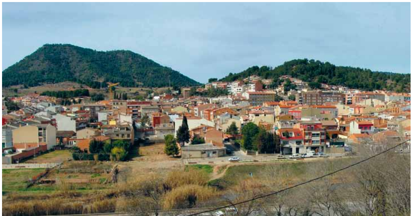
El treball fet els darrers anys ajudarà a orientar les polítiques del municipi a llarg termini

En una acció sense precedents a Sant Joan es van recollir 123 butlletes en què es van prioritzar els grans objectius del municipi en matèria de participació ciutadana, cohesió social, ocupació, entorn i cultura. Els cinc eixos es van prioritzar de la següent manera: adoptar un model de governança més participatiu (55 propostes), millorar i preservar els espais urbans (40 propostes), millorar les oportunitats laborals i d'ocupabilitat (31 propostes), aconseguir un poble socialment fort i cohesionat (31 propostes) i posar en valor els trets socials, culturals i esportius singulars (17 propostes). També es van rebre 11 propostes que no pertanyien a cap dels cinc objec-