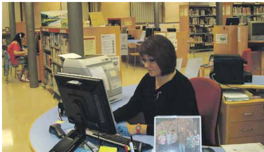
El centre compta amb una important activitat amb propostes contínues

La biblioteca s'organitza a partir de centres d'interès de diferents temàtiques que ajuden l'usuari a trobar tot allò que busca en un mateix espai. Hi ha els espais de cos i ment (material sobre l'equilibri del cos i la ment), món laboral (documentació per ajudar a trobar feina), fil i agulla (llibres i revistes sobre tècniques de cosir i altres manualitats) i aprenentatge de llengües (recursos sobre diferents llengües per fomentar un