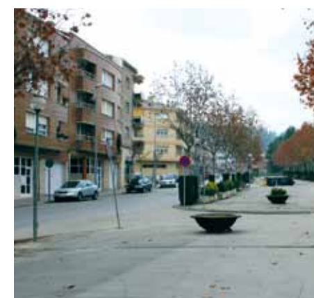
Es vol aconseguir un espai públic més net

excrements al carrer i les situacions en què els gossos van deslligats o sense morrió (en els casos dels gossos potencialment perillosos) i els orins a les façanes de les cases i al mobiliari urbà. La nova ordenança fixa l'espai de trama urbana com a zona en què els gossos tenen l'obligació d'anar lligats. A més, a través de la campanya es controlarà si els animals porten el xip obligatori i estan censats a l'Ajuntament.