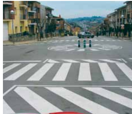
Accions de pintura i senyalització

en color vermell i blanc a l'entorn dels centres educatius. A més, s'ha urbanitzat el carrer Torres i Bages, s'ha obert el Passatge Sant Isidre i pel que fa a l'aparcament s'han creat noves places lliures i s'ha endreçat l'aparcament amb límit horari per afavorir la rotació i l'activitat comercial. També s'ha actuat al carrer Balmes i s'ha reparat el clavegueram del final del Torrent del Canigó.