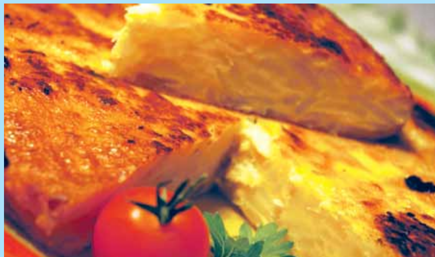
L'oferta de tapes és un dels trets distintius de Sant Joan de Vilatorrada

L'Ajuntament ha elaborat l'estudi que proposa a bars i restaurants participar d'aquesta iniciativa amb una tapa especial per a l'ocasió que es completaria amb una consumició a un preu atractiu. L'Ajuntament assumiria els