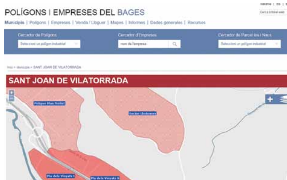
La nova pàgina web permet la cerca dels espais disponibles al municipi

Posar tota la informació a l'abast de qualsevol empresa que vulgui instal·lar-se en algun polígon industrial del Bages. Aquest és l'objectiu del web de polígons del Consell Comarcal ( www.poligonsiempreses.ccbages.cat ), que recull informació detallada i actualitzada de totes les àrees industrials i de les naus i parcel·les que hi ha disponibles, que en aquests moments són gairebé 500. El web va rebre més de 52.000 visites l'any passat. Per això, per