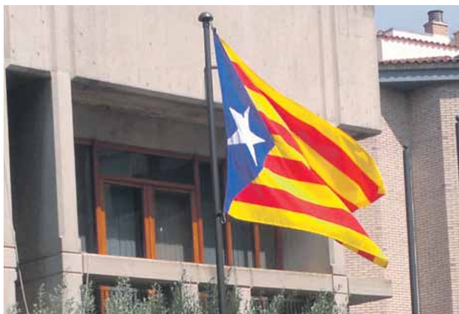
Fotografia de l'estelada a la façana de l'Ajuntament

Des de l'Ajuntament es participa activament del procés de transició nacional que viu el país. En aquest sentit, s'han portat a terme diferents iniciatives. El juliol de 2012 el ple va aprovar penjar l'estelada a la façana fins a la consecució de la independència. L'acció forma part de la campanya a nivell nacional impulsada per l'Assemblea Nacional de Catalunya. Coincidint amb els actes de la Diada, les marxes de torxes per la independència també es consoliden i cada any apleguen més ciutadans. Des del municipi també s'ha participat activament a les grans mobilitzacions de la Diada.