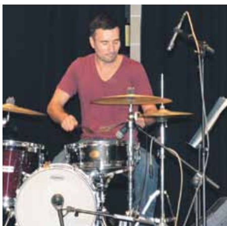
Els actes festius es consoliden gràcies a la implicació de les entitats i a les novetats que es van introduint any rere any

La Festa Major Infantil es confirma com un dels grans esdeveniments del municipi. Nens i nenes vingudes d'arreu de la comarca participen als actes. L'Ajuntament ha fet els primers passos perquè la festa sigui reconeguda com a Festa d'Interès Nacional.