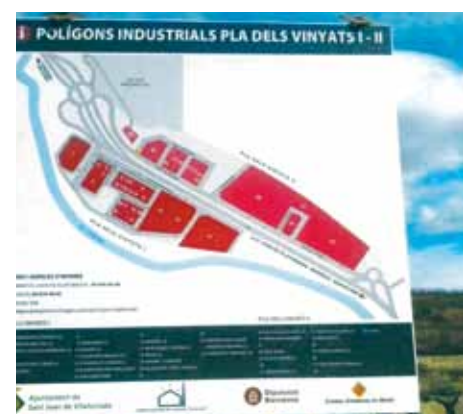
Col·locació de nous panells informatius

L'Ajuntament ha senyalitzat les empreses industrials dels Polígons Industrials Pla dels Vinyats I i II, així com els accessos a les diferents empreses i la relació de les naus actualment ubicades en sòl industrial, mitjançant la col·locació de panells informatius a les tres entrades dels polígons d'activitat econòmica. La voluntat és afavorir la informació i la possible atracció de noves empreses al municipi.