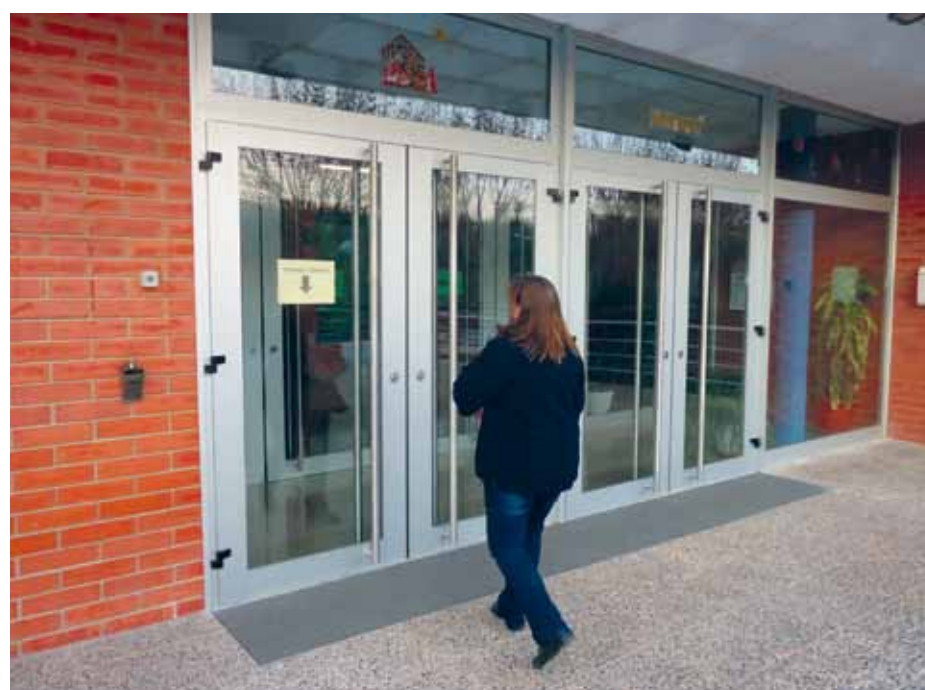
L'accés al Pavelló Municipal ha estat remodelat