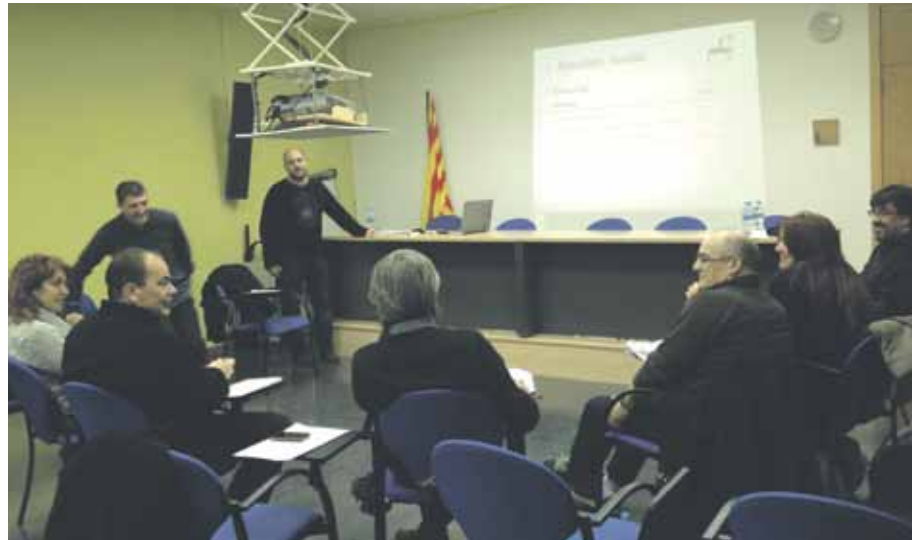
La taula de comerç treballa per enfortir el teixit comercial del municipi

L'Ajuntament ha treballat amb la complicitat de l'Associació de Botiguers i Comerciants durant els darrers anys en el marc de la taula de comerç. Es tracta d'un espai de debat i reflexió al voltant del comerç del municipi. Fruit d'aquestes trobades periòdiques els comerciants tenen l'oportunitat de compartir experiències i promoure noves accions per dinamitzar el teixit comercial de Sant Joan. Les trobades compten amb la participació d'experts i la taula de comerç té el suport de la Diputació de Barcelona.