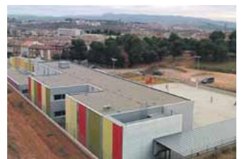
Imatge de l'escola Ametllers

el curs vinent i d'aquesta manera consolidarà tots els cursos de l'Educació Secundària Obligatòria (ESO). L'Ajuntament vetllarà per adequar les instal·lacions de l'institut al nou alumnat que es vagi apuntant i per això mantindrà un contacte permanent amb la conselleria d'Ensenyament de la Generalitat.