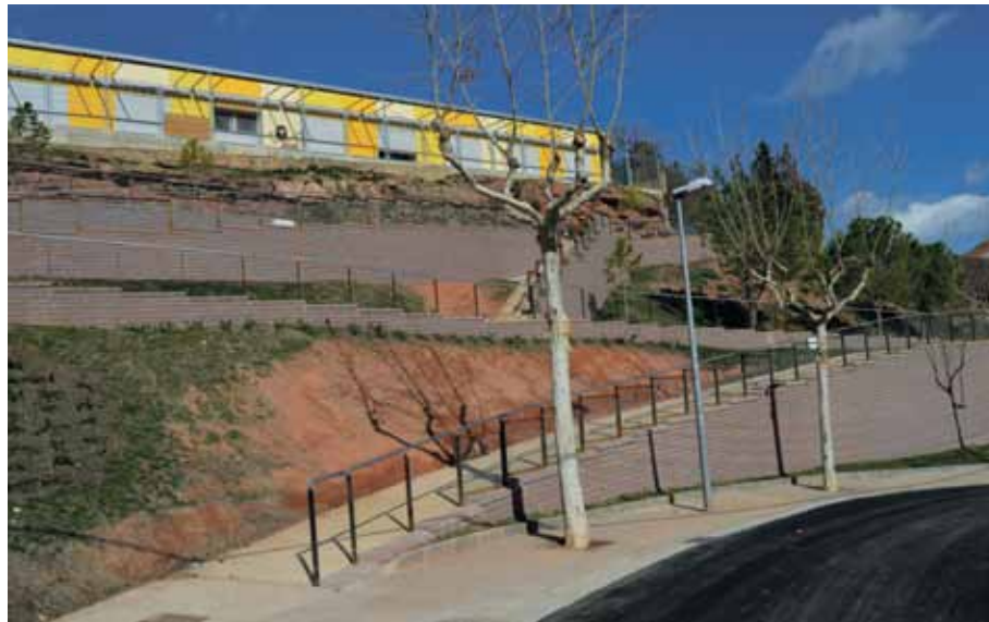
El PUOSC ha permès finalitzar l'accés al Mas Sant Joan i el cementiri municipal

L'Ajuntament de Sant Joan de Vilatorrada va aprovar el passat mes de desembre el pressupost per a aquest any 2015 que arriba als 9.150.000 euros, una xifra de continuïtat ja que no es vol condicionar el futur nou Ajuntament. La xifra d'aquest 2015 és un 0,4% superior al pressupost de 2014 i no s'ha considerat cap operació de crèdit tenint en compte que és un any electoral. Es vol que el proper Govern municipal pugui actuar sense condicionants. Malgrat tot es potencia la inversió en Serveis Socials que creix un 20%.