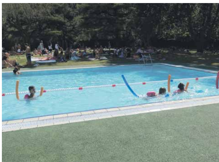
Les piscines municipals han tingut diferents actuacions els darrers anys

de nous para-sols que milloren el confort dels usuaris. Els horaris de les piscines municipals també s'han ampliat i es fan coincidir amb les vacances escolars. Les accions de la Bibliopiscina, les festes aquàtiques i la remullada nocturna han tingut bona resposta per part dels usuaris.