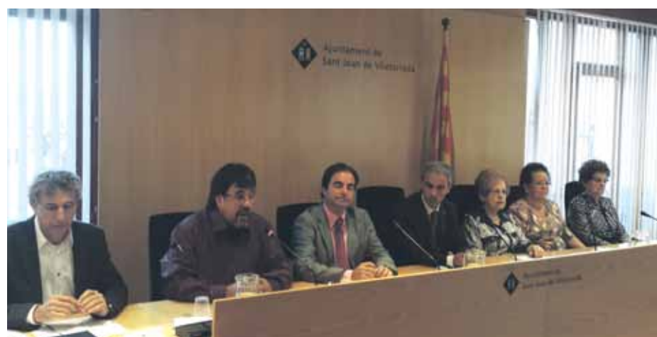
L'Ajuntament ha volgut restituir la figura de l'exalcalde, assassinat l'any 1939

i fidel als seus principis, va ser alcalde entre octubre de 1936 i maig de 1938 en un període en què es va preocupar que a Sant Joan sempre hi hagués pa per a tothom. Quan es va acabar la guerra va tornar de l'estranger convençut de la seva innocència. Al cap de poc va ser empresonat a Manresa pel règim franquista i posteriorment va ser traslladat a la Model de Barcelona. Finalment, va ser executat al Camp de la Bota.