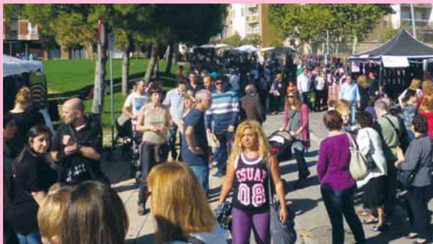
El document treballa per fomentar la diversitat i la convivència al municipi

El Pla proposa analitzar els recursos municipals i la xarxa ciutadana activa en relació a la gestió de la diversitat, elabora una diagnosi de la realitat social del municipi i