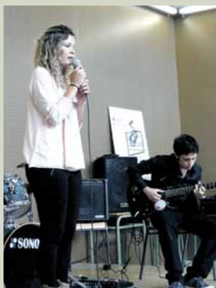
Foto dels Pòdiums de Música Moderna

Aquest curs el centre compta amb uns 300 alumnes i ha potenciat els convenis amb les escoles de primària gràcies a la bona predisposició dels tres centres i a l'entesa amb l'Ajuntament. Els alumnes de