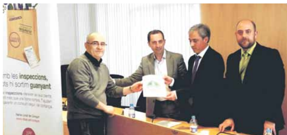
Imatge de l'acte de lliurament dels certificats de qualitat

L'actitud positiva dels comerços s'ha demostrat amb la voluntat d'adaptar-se a la normativa per part dels que, per desconeixement o altres motius,