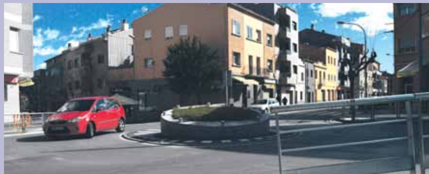
Imatge de la rotonda en un dels espais més transitats del municipi

Aquest proper estiu es complirà un any de l'entrada en funcionament de la nova rotonda a la cruïlla dels carrers Torrent del Canigó, Manresa i Avinguda Montserrat. La millora del trànsit ha estat més que notable en un dels punts que suporta més trànsit de vehicles al municipi.