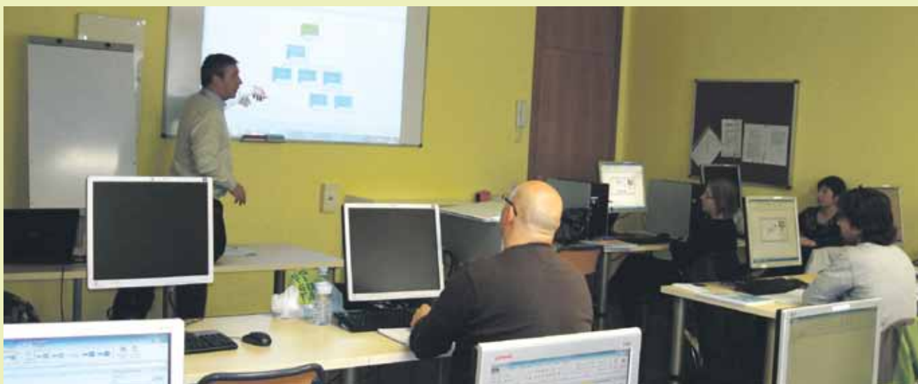
El CIO es referma com un espai de formació i coneixement amb una oferta contínua i adreçada a diferents públics

El Centre d'Iniciatives per l'Ocupació Cal Gallifa és un espai referent en la formació al Bages. El CIO ofereix els cursos de la Generalitat subvencionats a través del SOC, que l'any passat van tenir 30 alumnes formats en matèries com l'anglès i els serveis administratius, entre d'altres. En paral·lel, el CIO programa una formació pròpia per a persones desocupades que adquireixen coneixements per fomentar les seves possibilitats d'ocupabilitat. L'any passat més de 200 persones es van formar en coneixements TIC, màrqueting i xarxes socials, ofimàtica i presentacions de currículum. Finalment, el CIO compta amb una programació estable per a empreses i persones emprenedores que va atraure un centenar d'alumnes durant el 2014 amb sessions i tallers en què van adquirir coneixements de matèries pràctiques i útils presents en el dia a dia de les empreses, emprenedors i comerços.