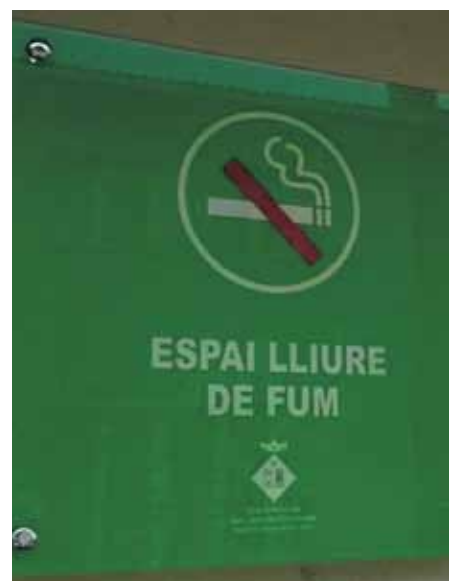
Imatge d'un dels cartells instal·lats

El Programa de Seguretat Alimentària es porta a terme des de l'any 2012 a Sant Joan per tenir un control respecte els establiments que treballen amb els aliments. Durant el 2014 i d'acord amb la programació de visites de control i vigilància es van portar a terme 72 inspeccions, de les quals 19 van ser a establiments d'alt risc i 53 a establiments de mitjà risc. Enguany es faran una cinquantena d'inspeccions més als establiments minoristes i es programaran dues sessions del curs bàsic de Seguretat Alimentària.