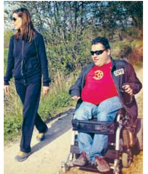
Imatge d'arxiu d'un circuit inclusiu

arquitectòniques habilitant passos adaptats per a persones amb mobilitat reduïda. En aquest sentit s'ha fet accessible la plaça de la Pau amb dues rampes i s'han adequat voreres i corregit nombrosos obstacles que dificultaven la mobilitat. A més, també s'ha actuat als lavabos de l'edifici de l'Ajuntament que han estat adaptats. El Pla d'Accessibilitat de Sant Joan, que compta amb el suport de la Diputació de Barcelona, indica que cal actuar a la Plaça Major, als parcs Garcia Lorca i Llobet, al Passeig del Riu i a la plaça Jaume I.