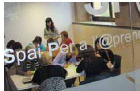
Es programen sessions i tallers

La Biblioteca és des de gener centre col·laborador ACTIC i permet a qualsevol persona major de 16 anys demostrar les seves competències TIC mitjançant una prova telemàtica. Hi ha 300 centres ACTIC arreu de Catalunya. La certificació és una oportunitat per a la millora del currículum professional. El servei té el suport del Centre d'Interès en Món Laboral.