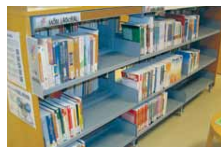
Recursos del centre Món laboral