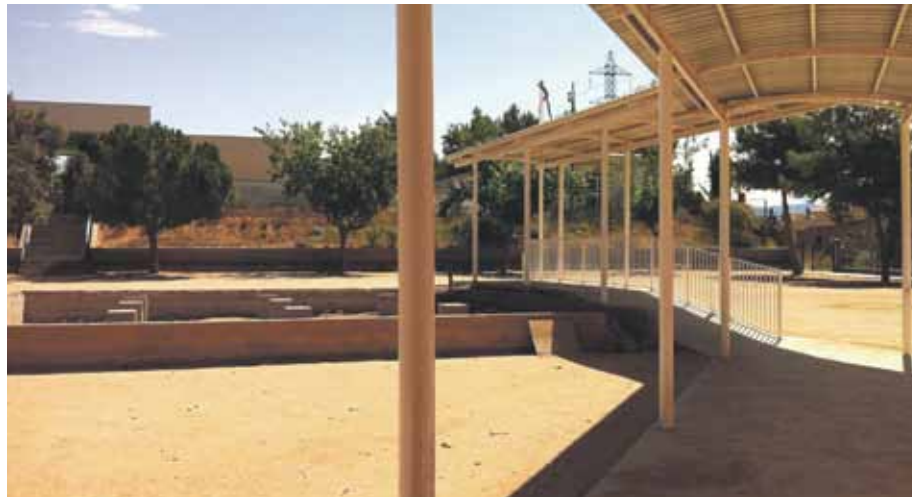
Els alumnes de l'escola Collbaix decidiran com volen equipar el pati del centre

A l'escola Collbaix, que ha superat els 25 anys de trajectòria, s'han fet importants obres de manteniment durant els darrers mesos. S'ha renovat la pintura i els lavabos i queda pendent l'adequació del pati un cop retirada la cargolera provisional. En el marc dels jocs florals, els alumnes ajudaran a projectar com queda el