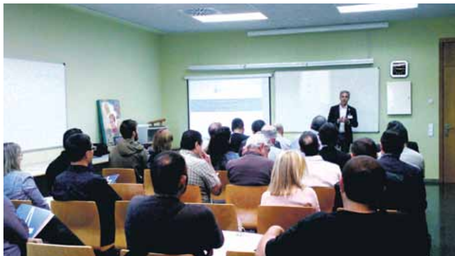
Les reunions serveixen per compartir inquietuds i tenir una relació més fluida

Una vintena d'empresaris responsables de les empreses dels polígons d'activitat econòmica Pla dels Vinyats I, Pla dels Vinyats II i del nucli urbà assisteixen a les trobades amb la participació de l'alcalde Gil Ariso i del regidor de Promoció Econòmica, Ramon Planell. L'Ajuntament ha elaborat un document amb les aportacions recollides i les propostes a realitzar fruit de les trobades. La idea és que tinguin continuïtat i que ajudin a establir una relació fluida entre l'administració i els empresaris industrials.