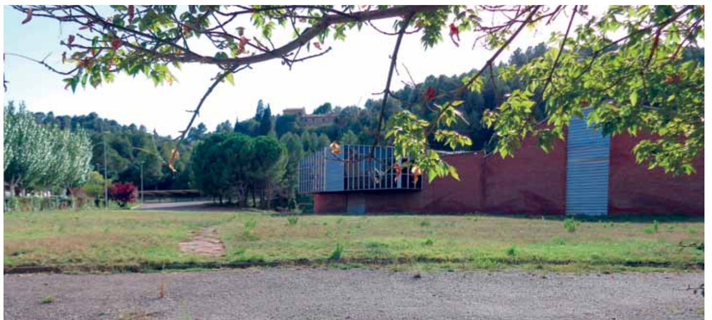
Els terrenys se situen a prop de l'IES Quercus i a l'estiu està prevista l'obertura d'un nou supermercat

L'Ajuntament ha aprovat en aquest mandat per una àmplia majoria el canvi d'usos de l'espai fabril de l'antiga Tèxtil Riba. Amb aquest tràmit l'espai de 32.000 quadrats deixa de ser industrial per convertir-se en una àrea residencial, d'equipaments, comercial i espais públics. L'aprovació és fruit d'un treball de consens iniciat el mandat anterior pels diferents grups polítics. Darrerament han començat les obres per a la construcció d'un nou supermercat que pertany a un grup valencià d'alimentació i que entrarà en funcionament aquest estiu.