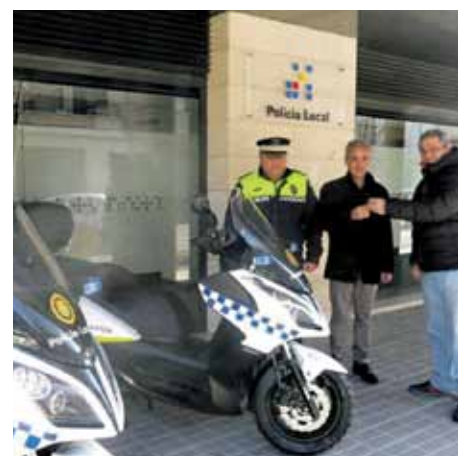
Fotografia de les dues motocicletes

La Brigada també ha estrenat un nou camió i espai de treball en una nau al carrer Montseny. Les antigues instal·lacions de Can Bargay han estat enderrocades ja que estaven situades en una zona verda inun-