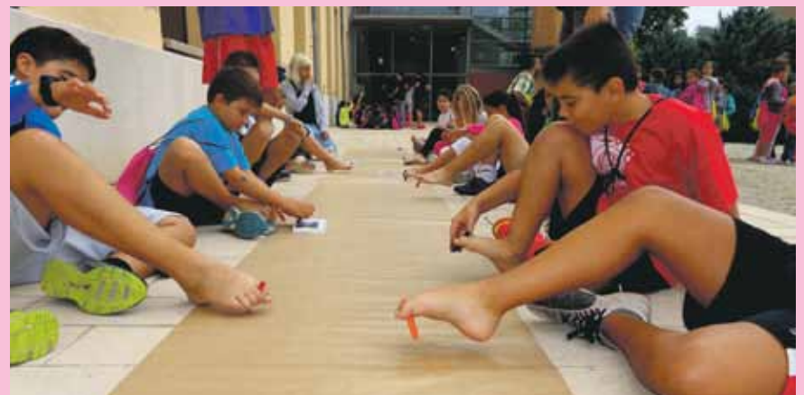
La web de la fira és www.firadiscat.cat

La fira compta amb la pàgina web www.firadiscat.cat en què es pot seguir tota l'actualitat del certamen.