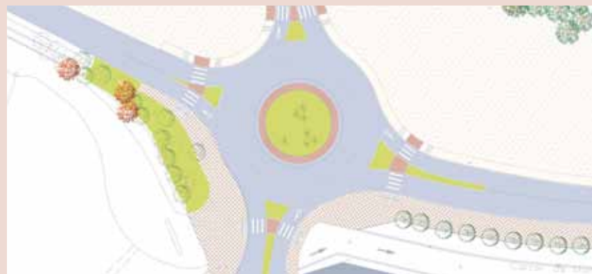
Plànol del projecte que permetrà endreçar l'espai i fer-lo més segur

quatre mesos i per tant demanem paciència als usuaris de la zona esportiva. El cost de l'obra serà d'uns 235.000 euros aportats per la Diputació de Barcelona. El projecte s'ha licitat per un preu inferior a l'inicialment previst. L'equip de Govern reforça la seva aposta per tenir un municipi més segur en què el trànsit de vehicles sigui més àgil.