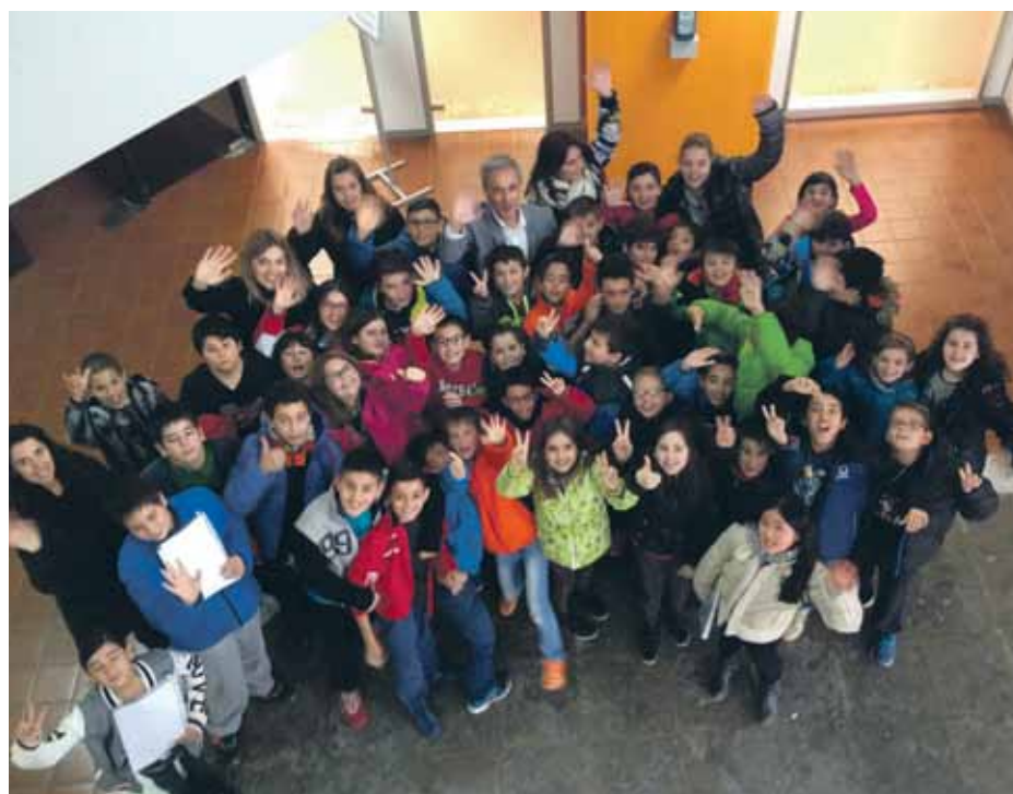
Imatge dels alumnes en la jornada en què van visitar l'Ajuntament

Tots els alumnes de l'aula participen del projecte i realitzen tasques com la de preparar la documentació de constitució de la cooperativa, el disseny del logotip i imatge corporativa, la fabricació dels productes, l'etiquetatge, la determinació del