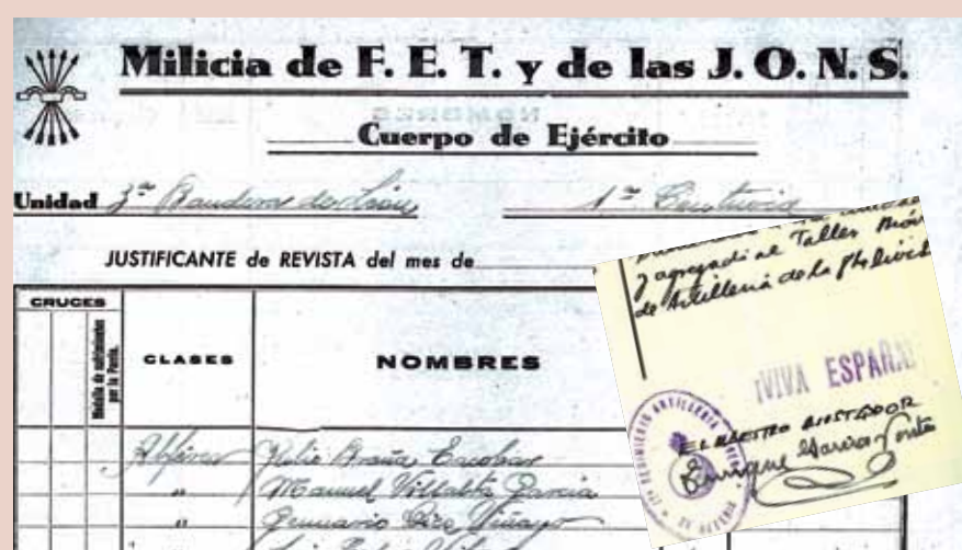
Els darrers documents trobats s'anitzaran properament