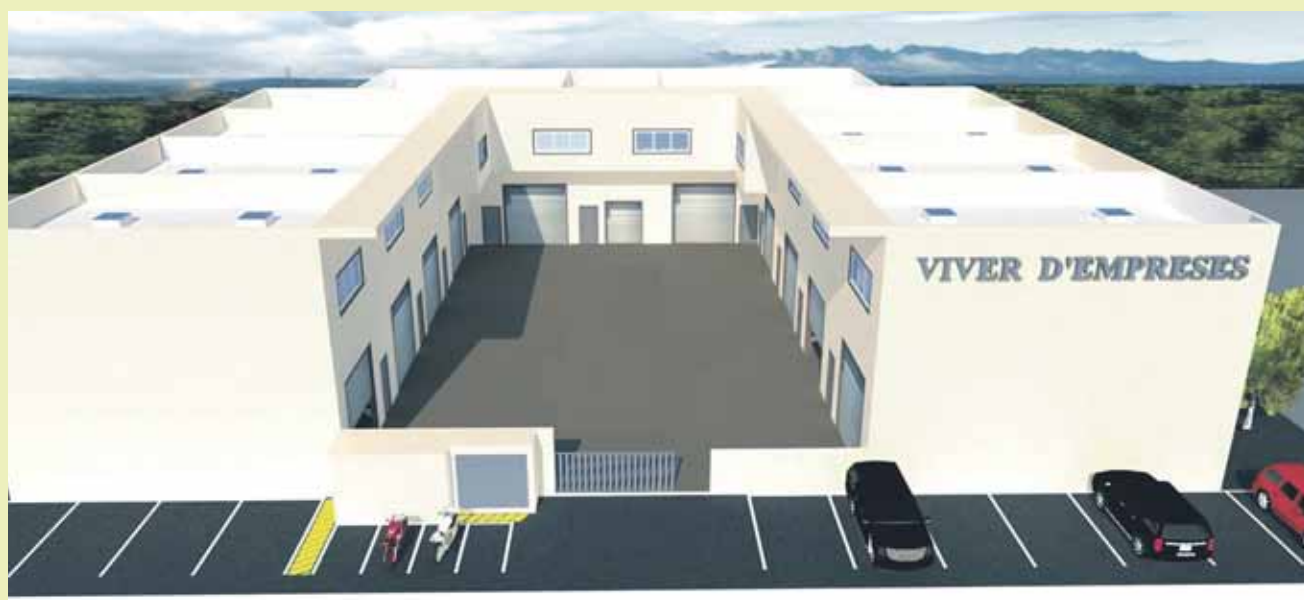
El viver es projecta en una nau de titularitat municipal ubicada al polígon Pla dels Vinyats

Per fer realitat aquesta iniciativa es preveu un espai amb deu tallers d'entre 75 i 80 metres quadrats al polígon Pla dels Vinyats II, en una nau de 800 metres quadrats de titularitat municipal. El viver s'ubicaria en un gran espai de planta baixa, que acolliria