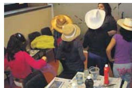
Els infants disposen d'espai propi