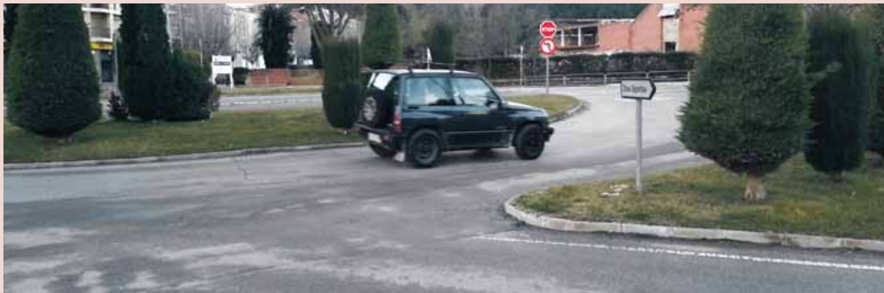
Imatge actual de l'entorn que és a punt de ser transformat en una rotonda

Una vegada iniciats els treballs es preveu que tinguin una durada de