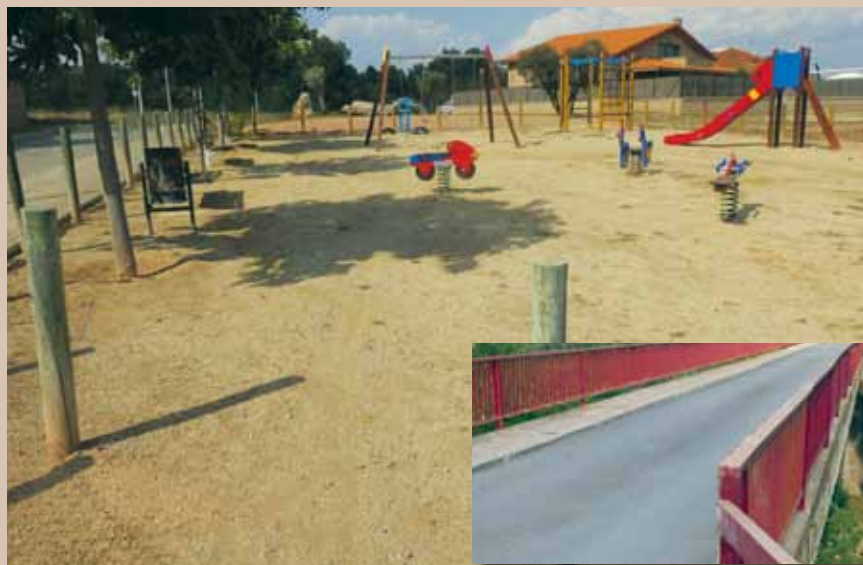
Imatge de les millores fetes al parc infantil i asfaltat del pont del Molinet

Durant els darrers quatre anys s'han dut a terme diferents accions de millora a l'Entitat Municipal Descentralitzada de Sant Martí de Torroella. En concret s'ha restaurat el parc infantil amb la compra de nou material urbà. En paral·lel, s'ha tancat el parc per evitar l'entrada de gossos. A més, s'ha comptat amb la col·laboració d'Aigües de Manresa per soterrar la línia d'aigües de l'empresa Macoba.