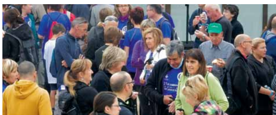
El document obtingut permet plantejar les polítiques en matèria de salut

El document, que ha comptat amb el suport de la Diputació de Barcelona, apunta algunes dades a tenir en compte. La diagnosi constata l'augment de la població major de 84 anys al municipi i destaca que el nombre mitjà de fills per dona va ser