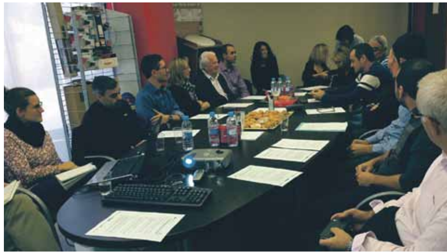
Imatge de la darrera reunió amb els empresaris industrials del municipi

L'Ajuntament de Sant Joan de Vilatorrada impulsa la creació de l'Associació d'empresaris del municipi a través d'una primera trobada amb una quinzena d'empresaris. En el marc de les reunions empresarials que es convoquen de manera periòdica s'ha treballat en aquesta proposta que ha tingut una molt bona acollida. L'àrea d'Empresa de l'Ajuntament de Sant Joan de Vilatorrada donarà tot el suport per formalitzar l'associació.