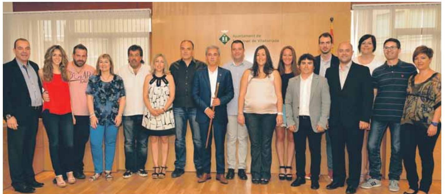
Imatge de grup amb els disset regidors que formen el ple de l'Ajuntament de Sant Joan de Vilatorrada

Els grups de l'oposició estan configurats de la següent manera: quatre regidors de Compromís amb Sant Joan, tres regidors del PSC i un regidor del PPC.