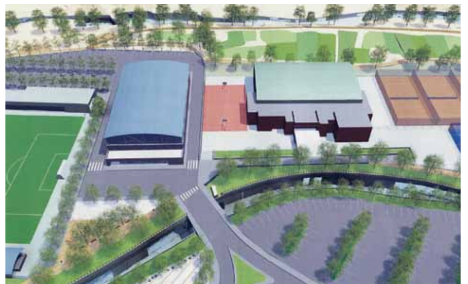
Imatge en què se simula l'actuació dissenyada al Pla Director

Aquesta urbanització comportarà fer més visible l'accés al Pavelló Esportiu que ara queda darrera el canyissar. A més, l'Ajuntament també estudia ampliar l'accés al camp de futbol per als vianants i fer-hi un espai verd amb parc infantil. Aquesta actuació es completaria amb una anella circular que resseguiria tot el perímetre de la zona esportiva. Funcionaria com un itinerari per al lleure i la pràctica esportiva a l'aire lliure.