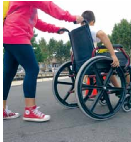
Imatge de la primera edició de Discat

El tercer projecte serà la consolidació de la Fira Discat que viurà la segona edició. A més de ser referent entre els professionals del sector, consciencia la població. En paral·lel, també s'impulsarà el pla d'inclusió municipal.