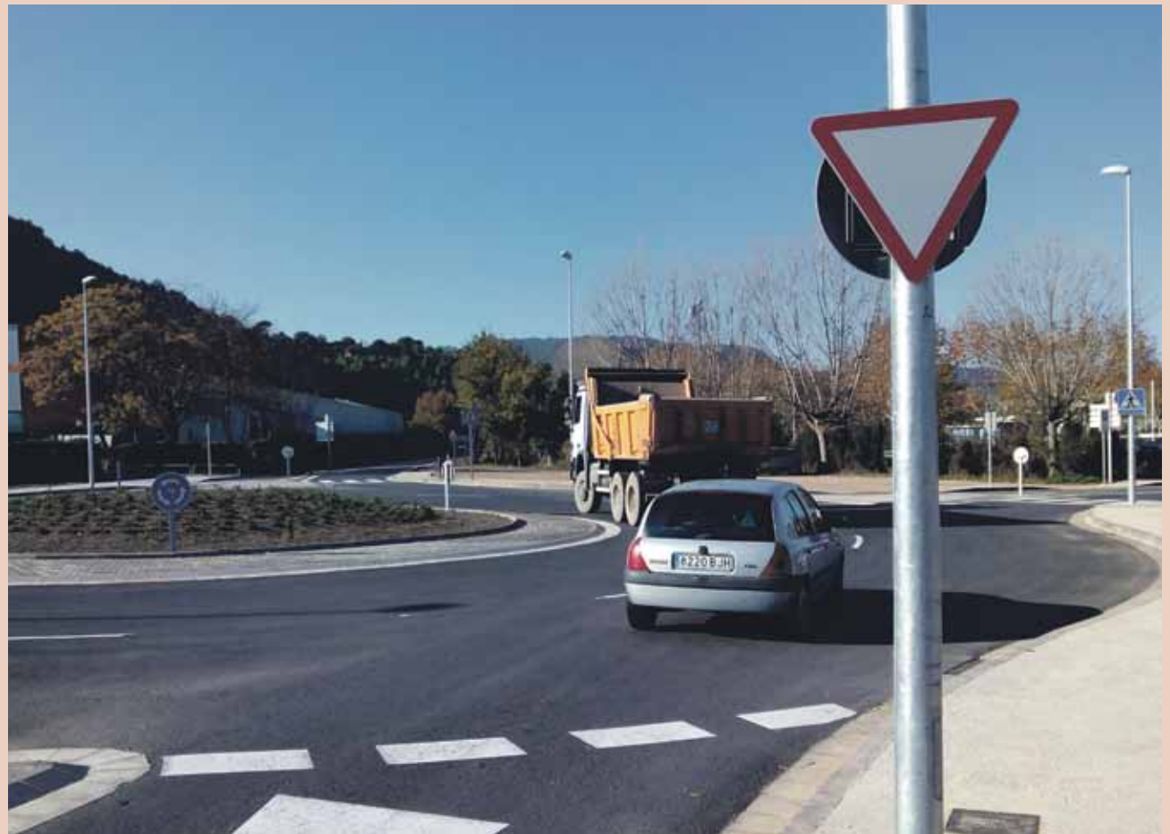
L'actuació ha permès millorar de manera notable la mobilitat i la seguretat a la zona nord del municipi

L'actuació ha permès millorar la seguretat tant per als vehicles com per a les persones perquè ara ja no cal travessar els carrils. Tot aquest entorn és molt transitat. L'antiga carretera de Calaf és utilitzada per als veïns dels nuclis de Fonollosa i Fals. La construcció de la rotonda ha tingut un cost de 235.000 euros, una xifra inferior a la prevista inicialment, i ha comptat amb el finançament de la Diputació de Barcelona.