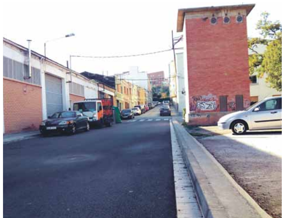
Fotografia del tram final del carrer Balmes que ha estat reurbanitzat

Una de les darreres actuacions en matèria d'urbanització dels carrers del municipi han estat les obres al carrer Balmes. Els treballs han permès reurbanitzar el darrer tram d'aquest carrer a tocar del Passeig del Riu.