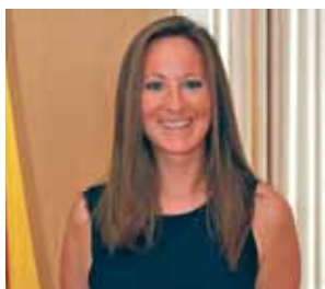
Xus Segura Benestar social i envelliment actiu Salut