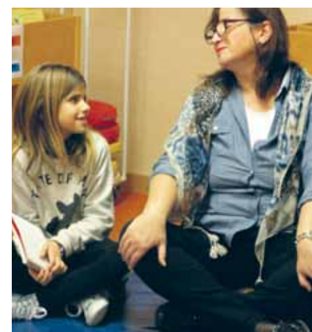
Aquest curs el programa compta amb dotze parelles lingüístiques