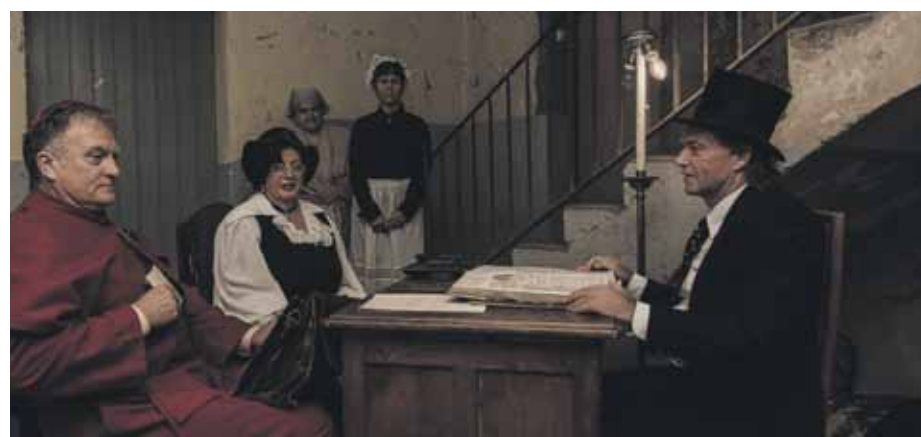
Les visites a les antigues fàbriques tèxtils, un dels punts forts del certamen

tiu. Enguany es va estrenar el nou espai de taverna-envelat a cel obert i es van introduir nous espectacles de carrer. A més, la tercera edició de la fira va reunir prop d'un miler de visitants a les visites teatralitzades a les antigues fàbriques tèxtils. L'Ajuntament de Sant Joan de Vilatorrada vol agrair la col·laboració de les entitats i la implicació a títol individual de desenes de persones que fan possible una festa molt popular.