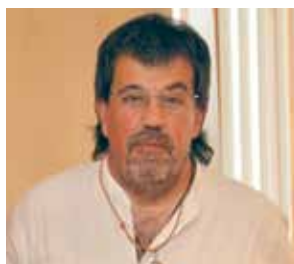
Jordi Pesarrodona Cultura i lleure educatiu Infància i joventut Igualtat, cooperació i ciutadania