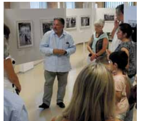
Imatge de l'exposició a la Biblioteca