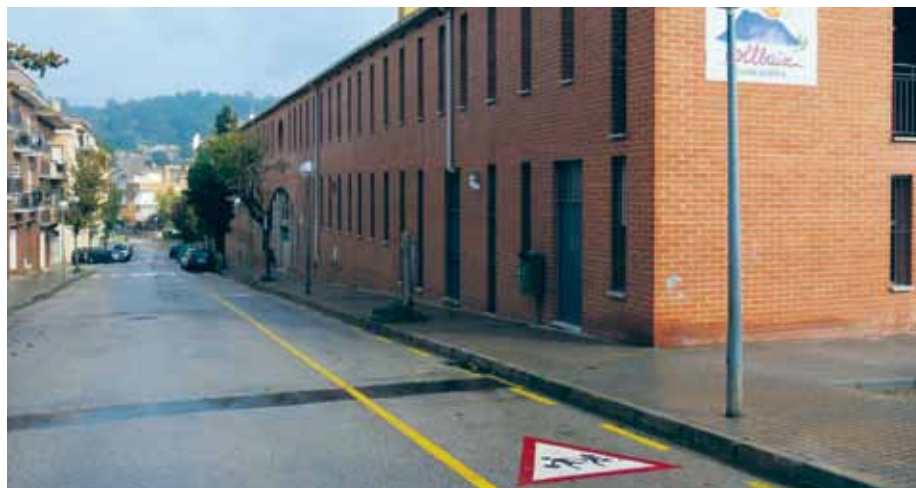
Les obres a l'entorn permeten major seguretat i una mobilitat més àgil

En paral·lel, s'ha senyalitzat un nou carril de càrrega i descàrrega al carrer Salvador Espriu per als pares i mares dels alumnes de quart, cinquè i sisè de primària. El carril ajudarà a una circulació més fluida en les hores d'entrada i sortida. Els treballs han comptat amb la super-