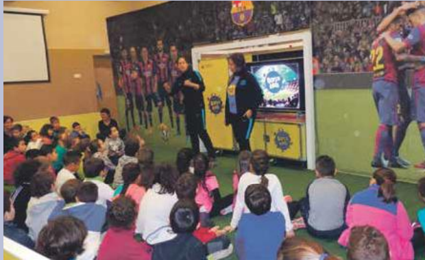
Les instal·lacions de l'Espai Jove van acollir el projecte

A partir de diferents activitats i des d'un rigor pedagògic es van promoure entre els infants l'anàlisi i