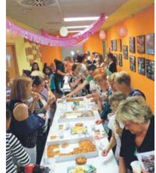
Acte de celebració del 30è aniversari

i implicació de professionals molts sensibilitzades, del suport de l'Ajuntament i de la Diputació, de l'Associació de l'Escola, del voluntariat i, en definitiva, de tot l'alumnat que ha cregut en la nostra tasca. A la nostra escola oferim diferents cursos, estem implicades en projectes i participem activament en les activitats culturals del municipi. També fem sortides al teatre, visites culturals i lúdiques, etc. En definitiva, una amalgama d'activitats i formació que fan que estiguem molt orgulloses de la nostra tasca. Gràcies a la ciutadania per la vostra participació, suport i suggeriments. Ens podeu trobar a la segona planta de Cal Gallifa. Seguirem el camí comptant amb tots vosaltres!