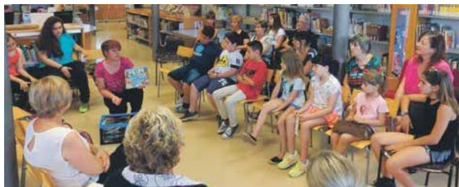
Els voluntaris dediquen una hora a la setmana a ajudar els infants a llegir

La regidoria d'Educació fa una crida per trobar nous voluntaris que puguin dedicar una hora a la setmana a acompanyar els infants en el món de la lectura i que permetin continuar el programa al setembre. Han participat alumnes de les tres escoles del