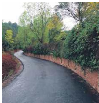
Imatges de l'accés al dipòsit d'aigua

litzacions. En concret, els operaris han fet actuacions al clavegueram dels carrers Tarragó, Joan Maragall, Manresa, Lepant, Migdia, Onze de Setembre, Morera, Prat, Pont, Canigó i Balmes. Totes aquestes accions es completen amb la feina feta l'any passat en el camí d'accés al dipòsit d'aigua potable. En concret, es va asfaltar el camí de Vilatorrada i es va reforçar el perímetre deixant el dipòsit tancat amb un cost global de 55.000 euros.