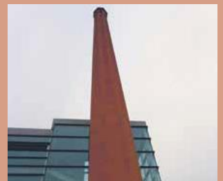
La xemeneia data del segle XIX

En breu començaran les obres de rehabilitació de la xemeneia de Cal Gallifa, un dels símbols del passat industrial de Sant Joan de Vilatorrada. Amb un pressupost de 18.000 euros els operaris col·locaran una bastida per fer la reconstrucció de la coronació i reparació d'alguns elements per evitar nous desprendiments.