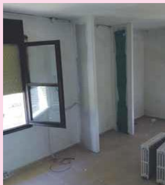
Imatge de les obres a la residència

ta baixa i a la primera planta, la residència podrà donar resposta a la demanda actual. Fins ara, el centre comptava amb 43 places concertades i quatre de privades. A partir de setembre l'Atzavara oferirà un total de 52 places. El pressupost del projecte d'obres inicial és de 45.000 euros i és previst que els treballs s'acabin durant els mesos d'estiu. Els operaris també han ampliat el vestidor per al personal del centre amb un espai més confortable.