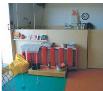
D'esquerra a dreta imatges de l'aula de lactants de la llar El Xiulet, de les cistelles de bàsquet de l'escola Joncadella i de l'Escola de Música

La regidoria d'Educació intensifica les accions de manteniment i millora als equipaments d'educació del municipi. A l'Escola de Música s'han pintat les aules, els passadissos i la recepció aconseguint una major amplitud i il·luminació. En paral·lel, els operaris han renovat i adaptat les cistelles de bàsquet de l'escola Joncadella, han canviat les portes d'emergència i s'ha reparat un mur del centre. A més, s'han fet treballs de pintura a l'aula de lactants de la llar d'infants 'El Xiulet'. Durant l'estiu també es pintaran aules i passadissos de l'Escola Ametllers.