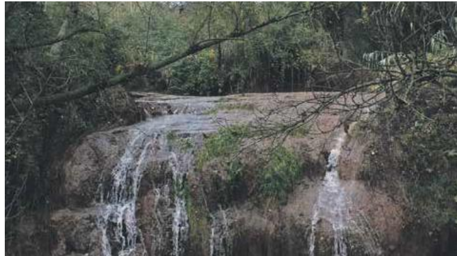
Dos operaris actuaran aquest estiu al Torrent Fondo

En el marc dels Plans d'Ocupació de la Diputació de Barcelona, l'Ajuntament de Sant Joan de Vilatorrada ofereix aquest estiu i fins a la tardor set llocs de treball temporal amb contractes d'entre sis i dotze mesos de durada. Els cinc primers contractes han començat aquest mes de juliol i els dos restants ho faran a l'octubre amb la voluntat de millorar la capacitat d'inserció de les persones en situació d'atur.