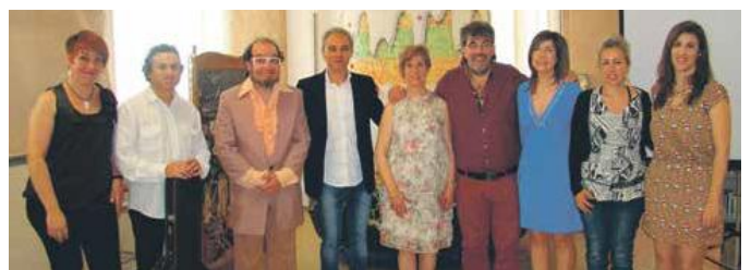
Fotografia de l'acte en què es van donar a conèixer les poesies finalistes del concurs

La mostra és oberta a petits i grans i ajuda promoure quelcom més que la poesia; una forma de veure i viure la vida des de moltes perspectives i vivències personals.