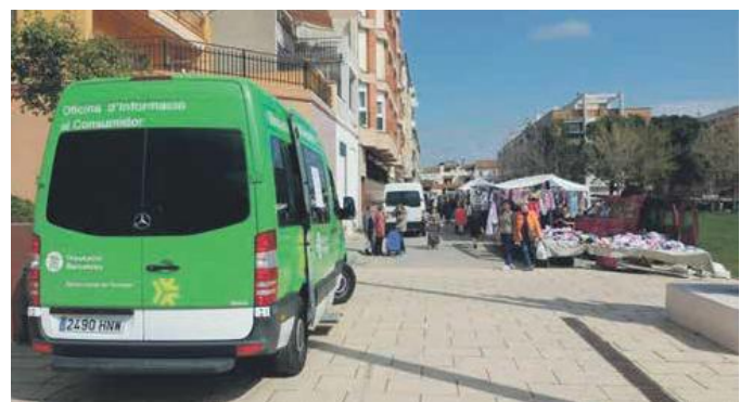
L'Oficina Mòbil d'Atenció al Consumidor accentua la seva presència al municipi

Mundial del Consum amb una exposició en què es donaven consells a la ciutadania per estalviar en les factures de la llum, el gas o l'aigua. A més, s'han fet els tallers adreçats als estudiants de secundària. Concretament els alumnes del SINS Cardener van participar en una sessió en què es va plantejar la privacitat i la seguretat a internet. Finalment, l'Ajuntament té presència a la Junta Coordinadora de la Xarxa Local de Consum de la Diputació de Barcelona.