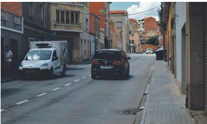
El carrer Riu Cardener ofereix una circulació més fluida