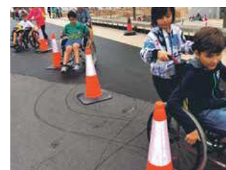
La Fira Discat tornarà a la tardor

torrada. L'Ajuntament ja treballa en els detalls de la segona edició i ja pot confirmar la presència de l'escriptor i periodista Màrius Serra. Es poden seguir totes les novetats a la pàgina web www.firadiscat.cat