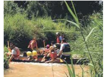
Imatges de l'acció Mulla't els peus al tram del riu Cardener