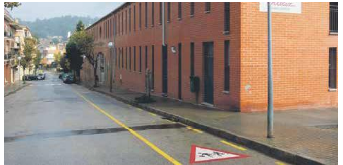
Fotografia d'un dels carrils d'estacionament que permeten un trànsit més àgil

En el marc de la iniciativa 'Petó i al cole' l'Ajuntament de Sant Joan de Vilatorrada ha aconseguit millores en el trànsit a l'entorn de les escoles Collbaix i Ametllers. El consistori ha habilitat un carril d'estacionament ràpid perquè els pares i mares deixen els seus fills a l'entrada de l'escola de manera àgil.