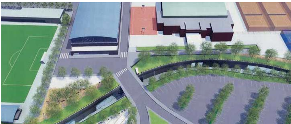
Imatge en què se simula l'actuació dissenyada al Pla Director

L'equip de Govern continua avançant per poder fer realitat el projecte que dibuixa una zona esportiva més endreçada i amable. El consistori ha aconseguit la implicació de la Diputació de Barcelona per cobrir part del finançament de les obres que es pretenen començar la primavera de l'any vinent. L'actuació con-