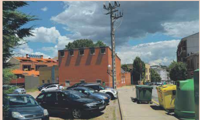
L'Avinguda Torrent del Canigó té un tram de passeig pendent d'urbanitzar

ha un gran solar que és utilitzat com a espai d'aparcament. L'Ajuntament de Sant Joan de Vilatorrada vol aprofitar l'actuació, que es podria iniciar el 2018, per habilitar un gran espai públic en forma de plaça. Hi hauria una zona verda, espai per als infants i la urbanització d'un tram de carrer nou. En paral·lel, es mantindria una part destinada a l'aparcament per evitar perdre places públiques. El projecte està en una fase inicial però es vol executar durant aquest mandat.