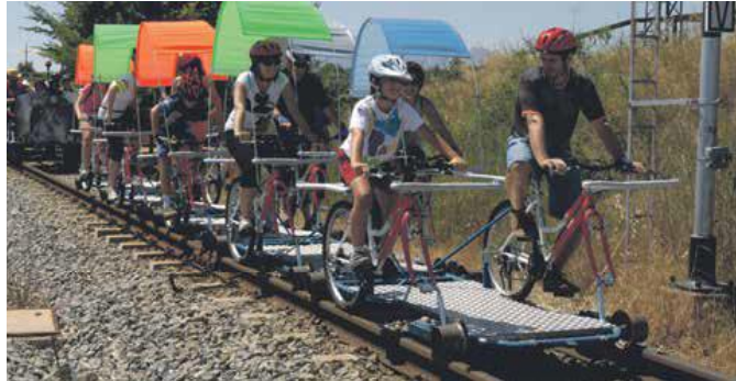
La recuperació de l'ecorail esdevé un dels reclams turístics de Sant Joan

Aquest juliol es recuperarà l'ecorail que passa en un tram llarg per Sant Joan en un recorregut familiar pels municipis del Cardener.