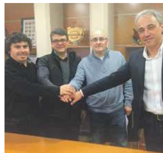
Signatura del conveni amb l'ABIC

El passat mes de desembre es va estrenar amb èxit el primer mercat de Nadal. De cara a setembre es preveu l'organització de la primera 'Shopping Night' de Sant Joan de Vilatorrada.