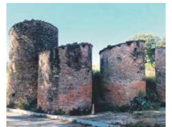
El circuit combina natura i paisatge urbà

Sant Joan de Vilatorrada ha dibuixat la primera ruta en BTT pel terme municipal dirigida al públic familiar. El recorregut s'ha dissenyat des d'un punt de vista lúdic i ofereix un circuit de 26 quilòmetres que ressegueix els principals elements d'interès del patrimoni històric i natural del municipi amb un desnivell acumulat de 338 metres. El recorregut ha estat ideat per l'empresa GuiesBtt.cat.