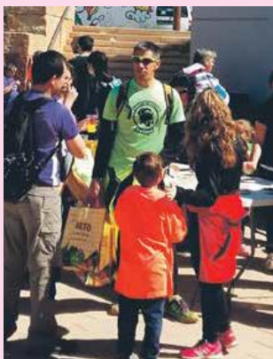
Es treballa per a un municipi cohesionat

El Pla d'inclusió estableix que es promogui la participació per dotar d'un sentit estratègic el document que tindrà continuïtat.