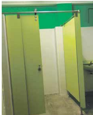
Millores a l'Escola Collbaix

L'Ajuntament ha completat les obres de millora a l'escola Collbaix. En concret, els operaris han renovat els vestidors del centre. S'ha canviat el terra, s'han pintat les parets i s'han instal·lat nous sanitaris i dutxes. S'ha actuat en dos vestidors per als alumnes i un espai per als monitors. Finalment també s'ha reparat una antiga esquerda en una de les parets.