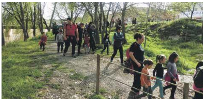
Imatge de la caminada programada el Dia Mundial de l'Activitat Física

El municipi ha recollit tot un seguit de dades amb el suport de la Diputació de Barcelona per fer una radiografia de la població. A partir d'ara es treballarà amb un projecte a quatre anys vista que en primer lloc propo-