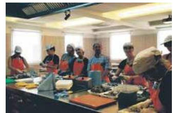
Imatge del curs de peixateria

El Centre d'Iniciatives per a l'Ocupació CIO Cal Gallifa incorpora a la tardor el curs de soldadura de 66 hores que serà homologable per als alumnes que cursin el cicle formatiu de grau mitjà 'Instal·lacions frigorífiques i de climatització'. El CIO consolida una oferta pròpia de formació amb els cursos de peixateria, carretoner i ACTIC.