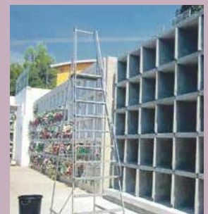
Imatge del cementiri municipal

L'Ajuntament de Sant Joan de Vilatorrada recorda a la ciutadania que manté obert el procés de recompra dels nínxols del cementiri. El consistori continua el procés per alliberar els nínxols que estan en desús i aprofitar al màxim la capacitat del cementiri. Les persones que siguin propietàries i no facin ús del nínxol es poden posar en contacte amb l'Ajuntament per concretar la venda.