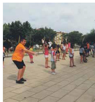
Imatges de de formació i de l'activitat de conscienciació 'Revetlles amb precaució'