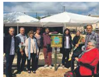
Imatge de presentació de la iniciativa

Des del mes d'abril funciona amb un gran èxit la bústia d'intercanvi de llibres al Parc Catalunya. Els usuaris poden agafar i deixar tants llibres com desitgin. La iniciativa compta amb el suport de la Biblioteca Municipal i es vol estendre a nous punts.