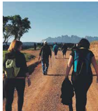
Imatge de la caminada de l'abril

una modalitat nocturna que creix any rere any. La quarta edició va reunir més de 600 corredors a l'abril a través de dos recorreguts de 5 i 10 quilòmetres. Sant Joan també programa amb èxit el cros escolar, les colònies esportives amb col·laboració de l'IES Quercus i més de 400 participants i proves de BTT. El calendari es va ampliant i també destaca la sortida del ral·li nocturn del Motor Clàssic Club Sant Joan i la corriolada. L'oferta és àmplia i està pensada per a tots els públics.