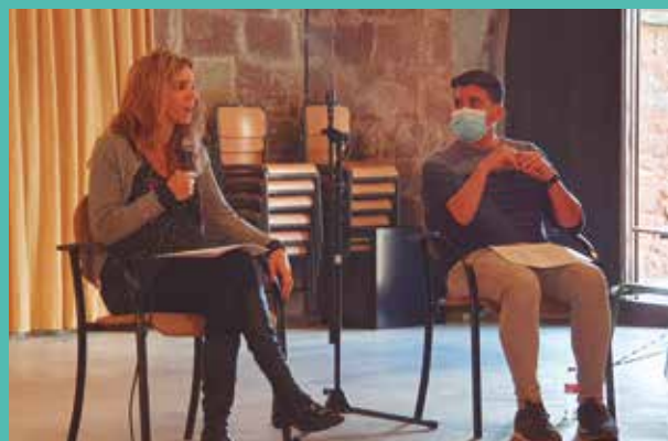
La presentació del protocol d'actuació davant les violències sexuals en espai d'oci

L'Ajuntament i la regidoria d'Igualtat tenen un ferm compromís per erradicar la violència masclista. Tenim molt clar que el masclisme és una xacra i lluitarem amb tots els recursos que siguin necessaris per aconseguir la igualtat entre homes i dones.