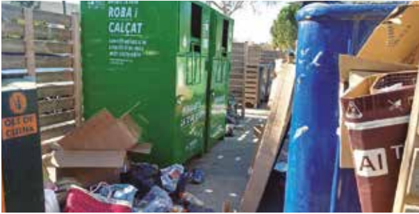
Imatge del Punt Verd el 2018

A l'inici del mandat 2019 – 2023 va retirar-se el Punt Verd ubicat a la zona del pàrquing del supermercat Dia , el qual suposava un problema per l'abocament continuat de voluminosos i deixalles i per la seva proximitat a l'espai on es fa el mercat setmanal. D'aquesta manera, també es van guanyar places d'aparcament i es va deixar la zona neta i transitable. Un cop analitzat el model de recollida, es va trobar oportú, juntament amb la Mancomunitat Intercomarcal del Cardener i el Consorci del Bages per a la Gestió de Residus, fer un canvi dels contenidors que hi ha repartits per la trama urbana, amb la decisió de completar les àrees de recollida amb totes les fraccions de reciclatge. Així, a tots els punts de recollida hi ha contenidors per recollir paper, vidre, envasos, rebuig i orgànica, de manera que s'evita la segregació de contenidors actuals. Els nous contenidors s'han repartit equitativament, respectant les àrees actuals que funcionen i creant alguna àrea nova en funció de la densitat de població de cada carrer.