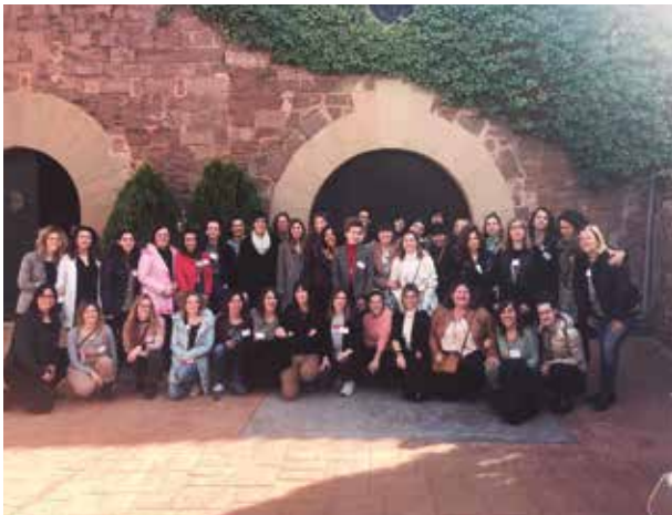
Una imatge de l'edició 2020 de La Filadora

Les jornades d'emprenedoria femenina són tot un èxit. Aquest any, es va celebrar la segona edició de La Filadora a Sant Joan de Vilatorrada. Enguany la trobada va ser telemàtica a causa de la pandèmia, i va concentrar a més de trenta dones del territori català.