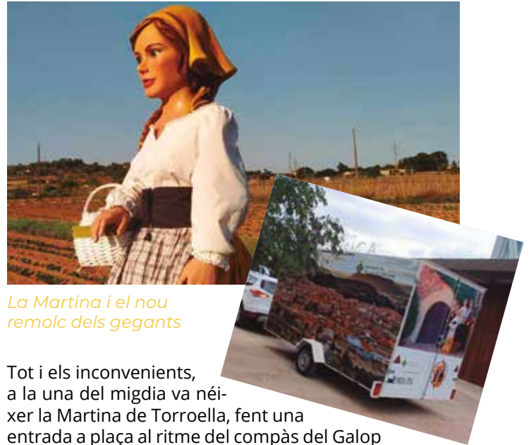
La Martina i el nou remolc dels gegants

Finalment, el dia 10 de novembre, vigília de Sant Martí, vam arrencar la celebració de la XXXVII Trobada de Gegants, en una plaça Major plena de gent i amb una desena de colles vingudes d'arreu de Catalunya i Menorca. Tot i això, la trobada no fou una tasca fàcil d'organitzar. Primer perquè la vam dur a terme fora de la data habitual del mes d'octubre, i segon, per la jornada electoral que se celebrava aquell mateix diumenge. Això va provocar, de forma temporal, la suspensió de la trobada, però després de molts esforços vam poder continuar planificant-la malgrat la situació.